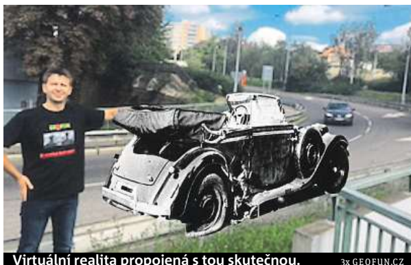
Virtuální realita propojená s tou skutečnou.