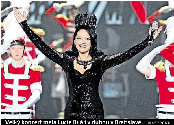
Velký koncert měla Lucie Bílá i v dubnu v Bratislavě.

Kdy: 5. a 6. listopadu Kde: O2 arena Kolik: od 490 korun Mnohonásobná česká slavičela Lucie Bílá letos slaví padesáté narozeniny. K nim se rozhodla si nadělit koncertní