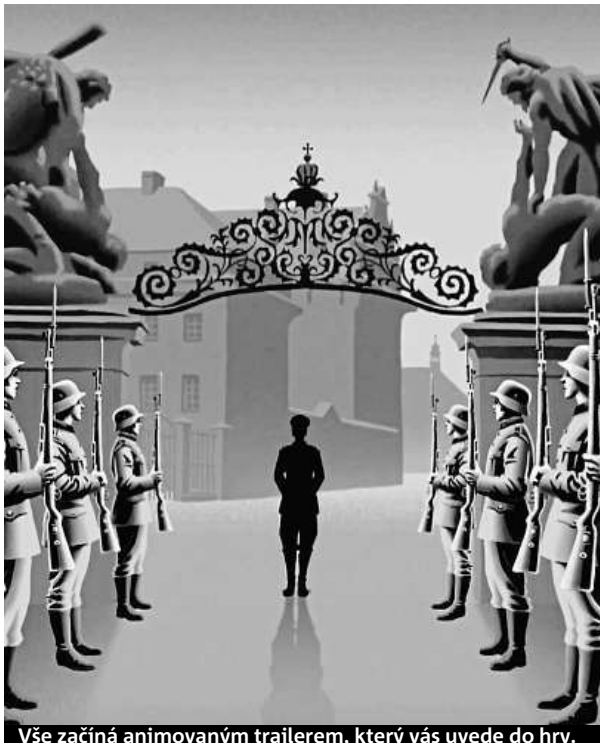
Vše začíná animovaným trailerem, který vás uvede do hry.

Součástí hry Operace Anthropoid je kromě historického příběhu také plnění úkolů a luštění šifer. „Pokud nejste moc silní v dějepisu, tak to vlastně vůbec nevdává. Sice vám budou za špatnou odpověď strženy body, ale do cíle se dostanete,“ slibuje Pechanec. Hra mimo jiné také obsahuje atraktivní animace a umožňuje díky virtuální realitě zobrazit původní Mercedes-Benz W142, kterým Heydrich projížděl přes pražské Kobylisy až na osudné místo atentátu.