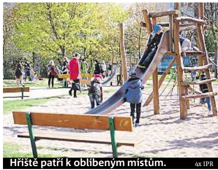
Hřiště patří k oblíbeným místům.

odpadky na ulicích, které létají z nechráněných popelnic. Ty by se tak podle návrhu mohly schovat do uzamykatelných kójí,“ popisuje jedno z vylepšení. Plán oživení navrhuje také vybudovat nová místa pro návštěvnické parkování před školkami, kde mají rodiče v ranní špičce pro-