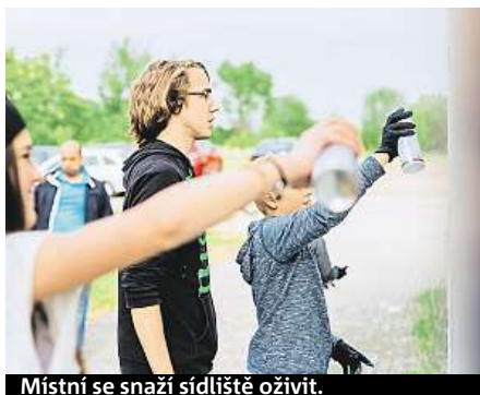
Místní se snaží sídliště oživit.

První konkrétní úpravy, které vznikly na přání místních, by se mohly začít realizovat už příští rok. „Je tu hodně pozapomenutých ploch, které čekají na novou náplň. Někde tak může vzniknout venkovní posilovna, jinde pingpongový stůl, lavička nebo záhonek,“ popisuje Marek Vácha, tiskový mluvčí Institutu plánování a rozvoje (IPR), kde návrh vznikal. „Obyvatelé si často stěžují na