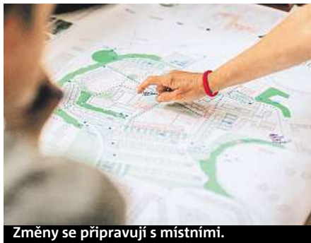
Změny se připravují s místními.