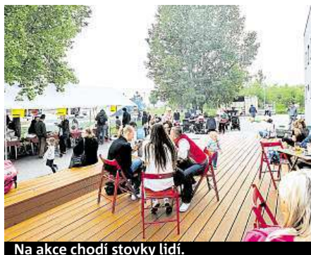
Na akce chodí stovky lidí.