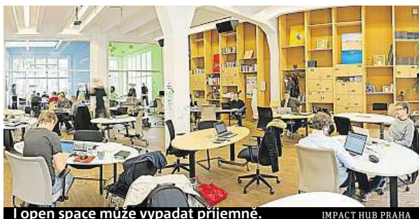
Open space může vypadat příjemně.

Nejde vám pracovat z domova a nechcete utrácet v kavárně? Objevte kouzlo prostorů, kde máte svobodu a potkáte nové lidi.