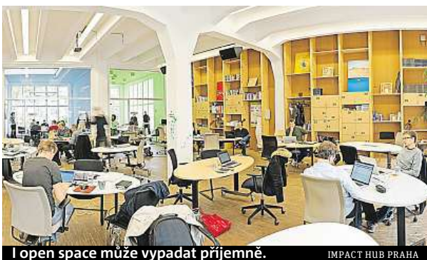
I open space může vypadat příjemně.

Před dvěma lety založila umělecká skupina Ztohoven Paralelní polis, třípatrový experimentální prostor spojující umění, společenské vědy a nové technologie. V budově v Holešovicích je k dispozici