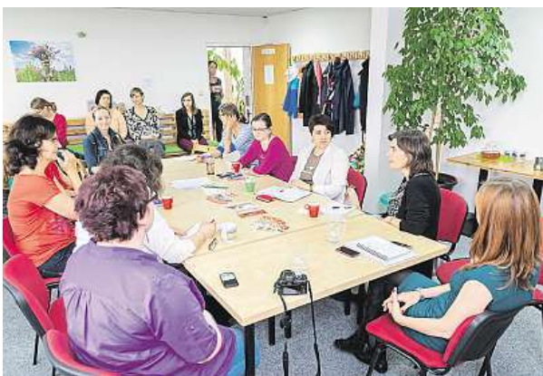
V Baby Office jsou vítány hlavně maminky.