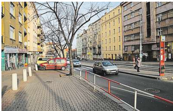
Možné úpravy Tábořské ulice v Nuslích představil Institut plánování a rozvoje Prahy na jaře.