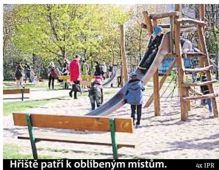
Hřiště patří k oblíbeným místům.

kovací plochy by navíc měly doplnit stromy a zeleň, což podpoří přírodní dojem ploch mezi paneláky.