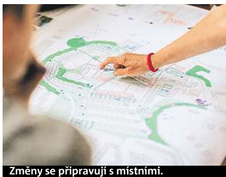
Změny se připravují s místními.

odpady na ulicích, které létají z nechráněných popelnic. Ty by se tak podle návrhu mohly schovat do uzamykatelných kójí,“ popisuje jedno z vylepšení. Plán oživení navrhuje také vybudovat nová místa pro návštěvnické parkování před školkami, kde mají rodiče v ranní špičce pro-