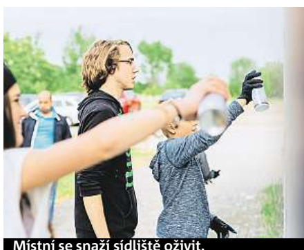
Místní se snaží sídliště oživit.

První konkrétní úpravy, které vznikly na přání místních, by se mohly začít realizovat už příští rok. „Je tu hodně pozapomenutých ploch, které čekají na novou náplň. Někde tak může vzniknout venkovní posilovna, jinde pingpongový stůl, lavička nebo záhonek,“ popisuje Marek Vácha, tiskový mluvčí Institutu plánování a rozvoje (IPR), kde návrh vznikl. „Obyvatelé si často stěžují na