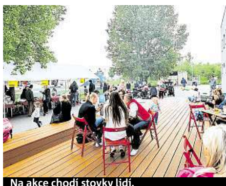
Na akce chodí stovky lidí.

Odborníci navrhnou reorganizovat celý systém parkování. Obyvatelé sídliště by získali více a lépe organizovaných míst k parkování, což umožní uvolnit místa kolem křižovatek nebo chodníků, kde překážejí chodcům. Par-