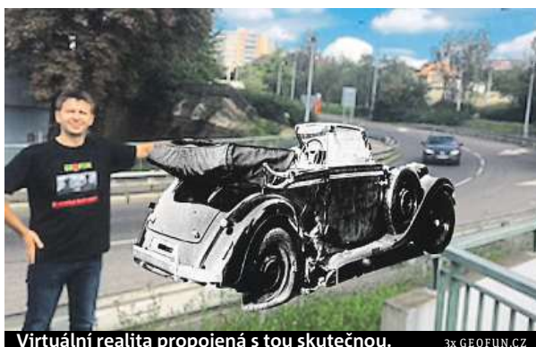
Virtuální realita propojená s tou skutečnou.