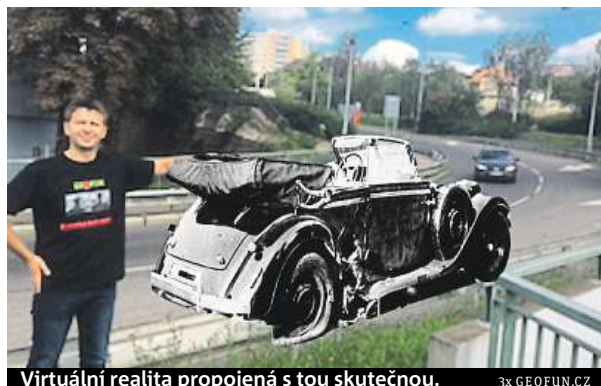
Virtuální realita propojená s tou skutečnou.