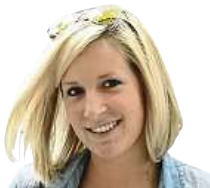
TROTAMUNDOS VĚČNÁ CESTOVATELKA A OBDDIVOATELKA ZAJÍMAVÝCH KULTUR

Krásně to křupe, a i když vám to všude padá, nikdo se vám nebude smát. Velmi často jsem si na ulici dávala i chile relleño neboli plněnou chili papričku. Náplň byla většinou z mletého masa a ze zeleniny nebo vejce, paprička někdy páčila a někdy vůbec, ale to mě na tom právě bavilo, ten moment překvapení. Zato s dezerty jsem zde trochu bojovala, vše bylo sladší, než bych si přála, nebo přesmažené či moc překombinované. Mléčná rýže se skořicí v Latinské Americe nikdy nezklame, ale nakonec jsem skončila u skvělé čokolády vyráběné z místního kaka, které můžu jen doporučit.