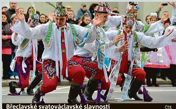
Břeclavské svatováclavské slavnosti