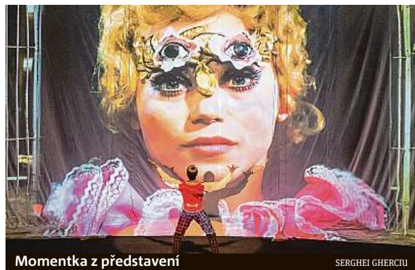
Momentka z představení

Světový úspěch tohoto divadelního unikátu překvapil. Nikdo ale netušil, že se Kouzelný cirkus bude hrát ještě dalších pětadvacet let, od roku 1983 na Nové scéně. „Rád bych u příležitosti derniéry této legendární inscenace poděkoval všem, co se na Kouzelném cirkusu kdy podíleli. Byla to vždy inscenace, která stála nejen na silné umělecké a tvůrčí výpovědi, ale také na