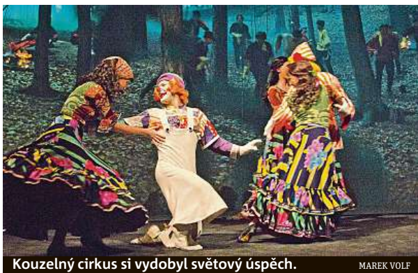
Kouzelný cirkus si vydobyl světový úspěch.

Laterna magika vzdává hold této legendě oslavou derniérou, která se odehraje ve středu, na svatého Václava. A nutno říci, že to není loučení definitivní. Kouzelný cirkus se totiž přenáší do nové podoby, do on-line prostoru a budou ho moci zhlédnout i další a další generace po celém světě. Zároveň bude již ode dneška na náměstí Václava Havla možnost zhléd-