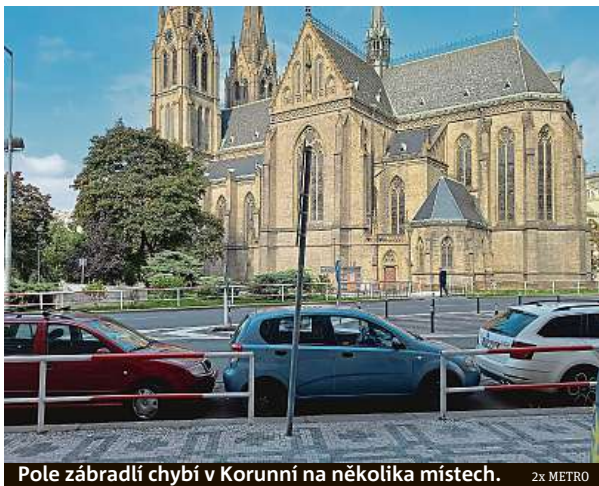
Pole zábradlí chybí v Korunní na několika místech. 2x METRO

Vedení hlavního města se tento měsíc pustilo do velkého odstraňování zábradlí. Náměstek primátora pro dopra-