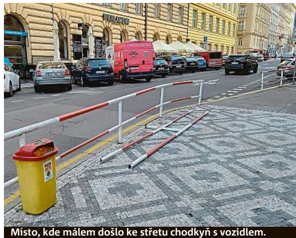
Místo, kde málem došlo ke střetu chodkyň s vozidlem.