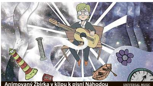
Animovaný Zbirka v klipu k písni Náhodou

Kapela Lucie se po 20 letech vrací s projektem Lucie v Opeře, tentokrát s výraznějším využitím symfonického orchestru, navíc v nových aranžích. Z turné vznikne i nahrávka nejuspěšnějších skladeb, které ještě před Vánoci vyjdou ve formě nového alba. Retrospektivní lyric video ke známé písni Černí andělé vytvořil pro kapelu s Michalem Dvořákem Vítek Čermák. Lu-