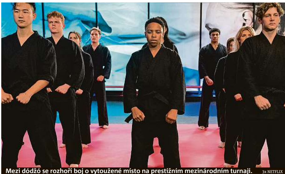
Mezi dódžó se rozhoří boj o vytožené místo na prestižním mezinárodním turnaji.

Cobra Kai je pecka, která k vyvolávání tesku po starých časech a retro atmosféry nepotřebuje zbesilou stylizaci, ale spíše klasické až dětské pojetí akčního žánru s pří-