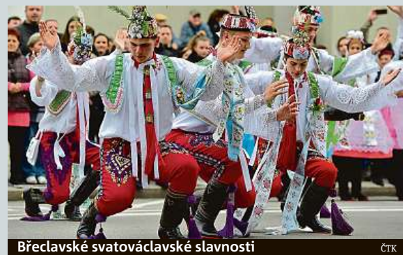
Břeclavské svatováclavské slavnosti