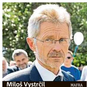
Miloš Vystrčil