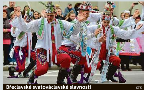
Břeclavské svatováclavské slavnosti