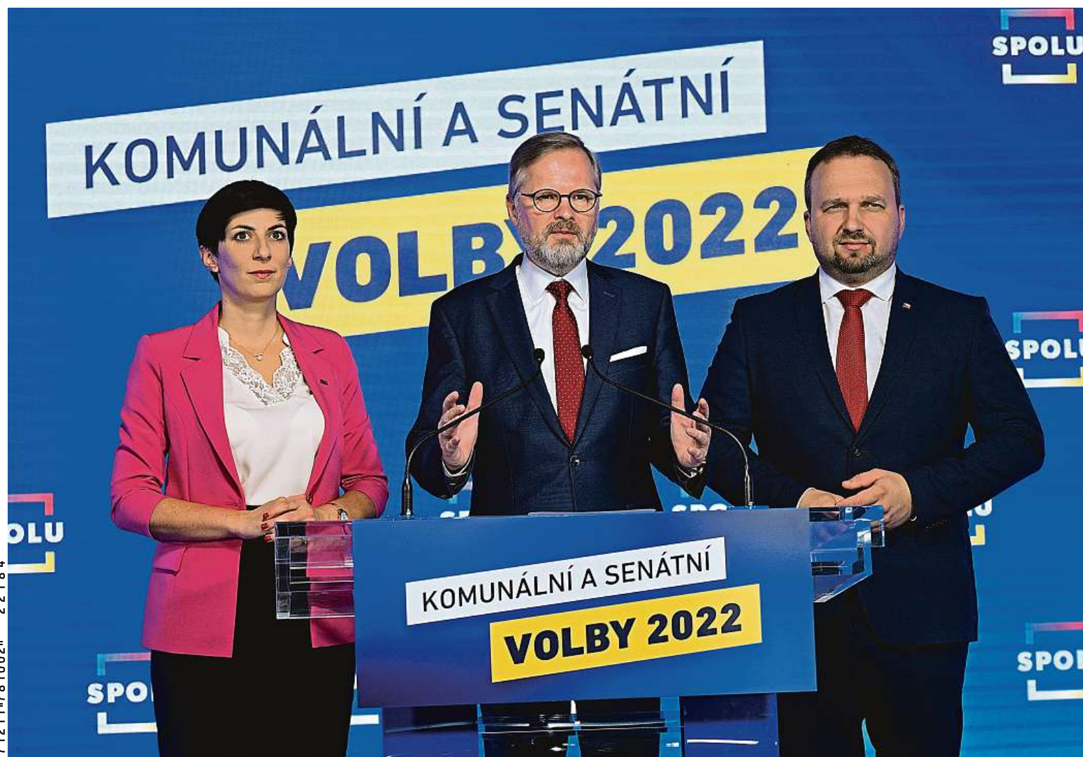
Předsedové ODS, TOP 09 a KDU-ČSL a zároveň lídři koalice Spolu komentují výsledky komunálních a senátních voleb.

Nezávislí. V obecních volbách posbírali nejvíce mandátů. Rozdělená země. ANO ovládlo většinu krajských měst, Prahu i Brno má Spolu. SPD pronikla do zastupitelstev. Senát. Tři místa jsou jasná po 1. kole STRANY 2-5