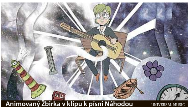
Animovaný Zbirka v klipu k písni Náhodou

Kapela Lucie se po 20 letech vrací s projektem Lucie v Opeře, tentokrát s výraznějším využitím symfonického orchestru, navíc v nových aranžích. Z turné vznikne i nahrávka nejuspěšnějších skladeb, které ještě před Vánoci vyjdou ve formě nového alba. Retrospektivní lyric video ke známé písni Černí andělé vytvořil pro kapelu s Michalem Dvořákem Vítek Čermák. Lu-