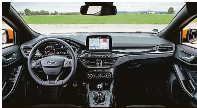
Volant se příjemně drží, řadič páka perfektně padne do ruky.