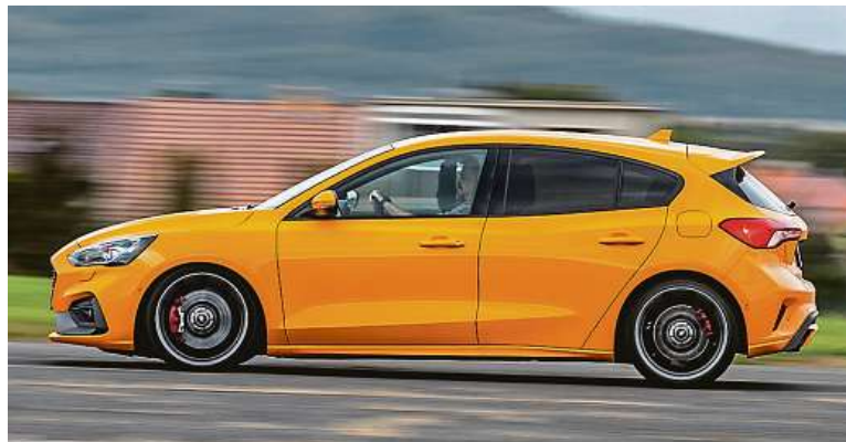
Verze ST je o centimetr nižší k vozovce než běžná verze Focusu.