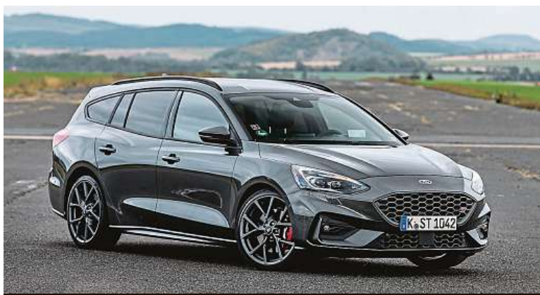
Kombíku v tmavé barvě to velice sluší, co myslíte? A ty červené brzdy!