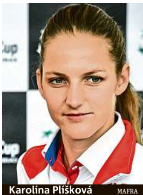
Karolína Plíšková

Sedmadvacetiletá Plíšková na úvod ve Wu-chanu porazila osmnáctiletou Amandu Anisimovovou, ale proti další teenagerce, o rok starší Jastremské, včera byla prakticky bez šance. Sedmadvacetiletá hráčka žebříčku zasypávala českou favoritku tvrdými