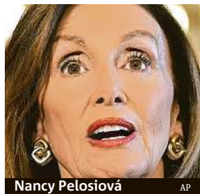
Nancy Pelosiová

Americká Sněmovna reprezentantů zahájí proces přípravy ústavní žaloby na prezidenta Donalda Trumpa. Ozámila to včera šéfka dolní komory parlamentu, demokrátka Nancy Pelosiová. Procedura takzvaného impeachmentu může vést k odvolání prezidenta, což ale vzhledem k převaze Trumpových republikánů v Senátu není příliš pravděpodobné.