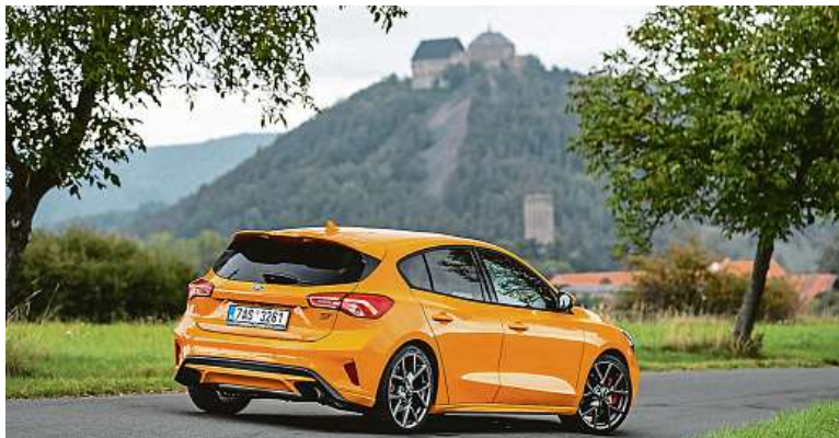
Ford Focus ST není žádný žebřák. To je ten hrad na horizontu.