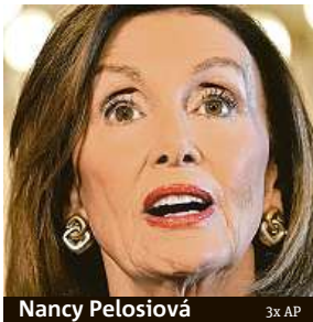
Nancy Pelosiová

Vše se točí kolem telefonátu, který měl americký prezident se svým ukrajinským protějškem.