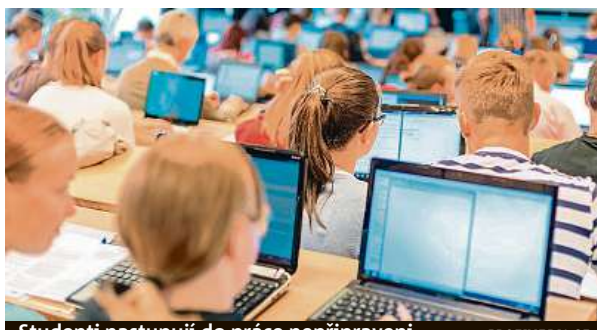
Studenti nastupují do práce nepřipraveni.

Mladí chtějí také srovnávat soukromé a firemní hodnoty. Rovněž u svých zaměstnavatelů, spolupracujících firem a institucí hledají zcela nové parametry, jako je odpovědnost, udržitelnost, diverzita, respekt a možnost se zapojit do dobré věci. Jak například zaznělo na Expertním panelu Mladé Česko, který byl letos v červnu uspořádán ve spolupráci s Coca-Cola HBC Česko a Slovensko: „Peníze jsou důležité, ale nejsou nejpodstatnější. Jsme zvyklí pracovat hodně a intenzivně a děláme