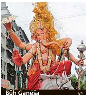
Bůh Ganéša

Mohutná zvířata nemají ve městě tolik možností k pohybu, jak měla dříve.