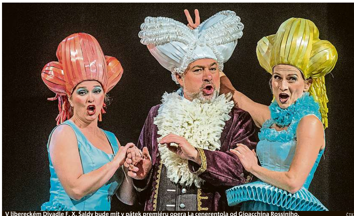
V libereckém Divadle F. X. Šaldy bude mít v pátek premiéru opera La cenerentola od Gioacchina Rossiniho.

Přísnější pravidla. Od příštího týdne dosáhne na hypotéky méně lidí než dosud. Za pět dvanáct. Koncem léta vzali zájemci o bydlení banky útokem. Rodiče. Bez nich nemáme šanci, myslí si třetina mladých STRANA 2