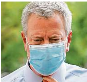
Bill de Blasio

„Počínaje dneškem dáváme našim ředitelům pravomoc maximálně využít venkovní výuku,“ sdělil v pondělí starosta s tím, že si je vědom, že ani případné učení pod širým nebem nemůže šíření koronaviru mezi žáky zcela zabránit.