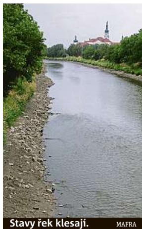
Stavy řek klesají.

Vážným suchem byla zasažena více než polovina střední Evropy, což z něj činí největší dvouleté sucho ve více než 250leté historii. Studie publikovaná v časopise Scientific Reports očekává, že četnost závažných dvouletých období sucha do konce století několikrát vzroste. „Zastavíme-li emise skleníkových plynů, klimatické modely předpokládají, že počet těchto období bude v druhé půlce století až o 90 procent nižší, než při výrazném růstu koncentrací skleníkových plynů,“ uvedl jeden z autorů