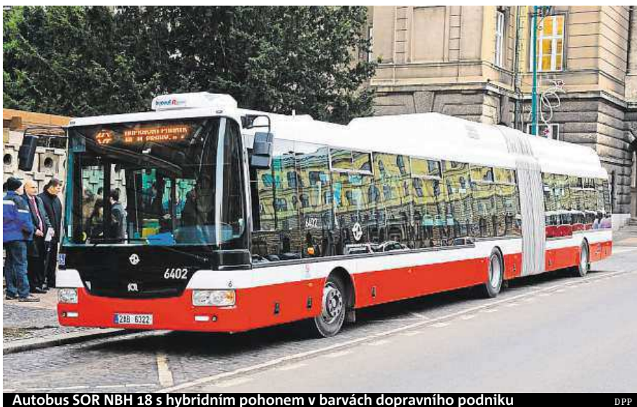
Autobus SOR NBH 18 s hybridním pohonem v barvách dopravního podniku