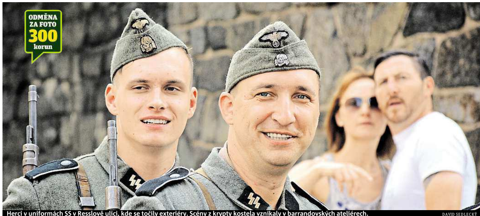
Herci v uniformách SS v Resslerově ulici, kde se točily exteriéry. Scény z krypty kostela vznikaly v barrandovských ateliérech.