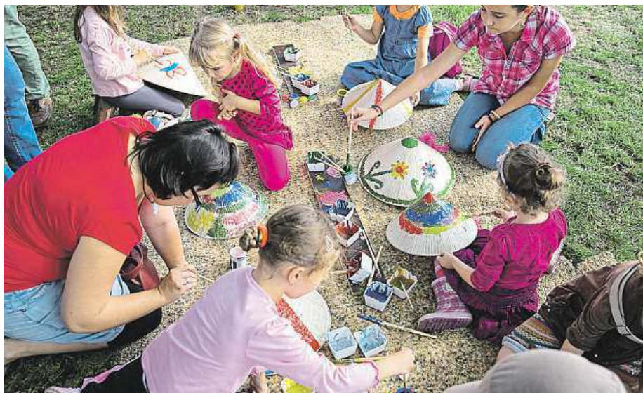
Festival nabídne ukázky tradičních lidových tanců, workshopy pro dospělé i ty nejmenší...