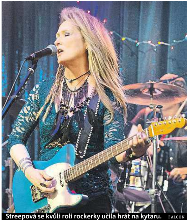
Streepová se kvůli roli rockerky učila hrát na kytaru. FALCON

Zpočátku se věnovala divadlu. Na sklonku 70. let ale okusila film a záhy získala první nominaci na Oscara za