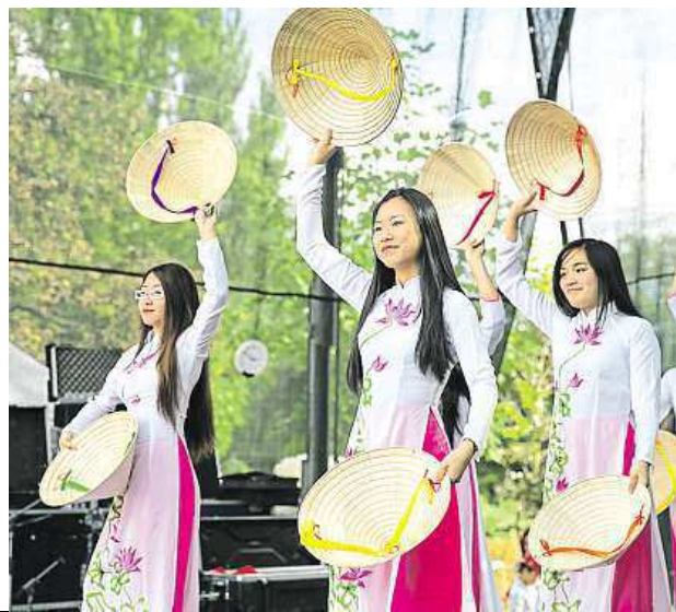
3x BAREVNÁ DEVÍTKA