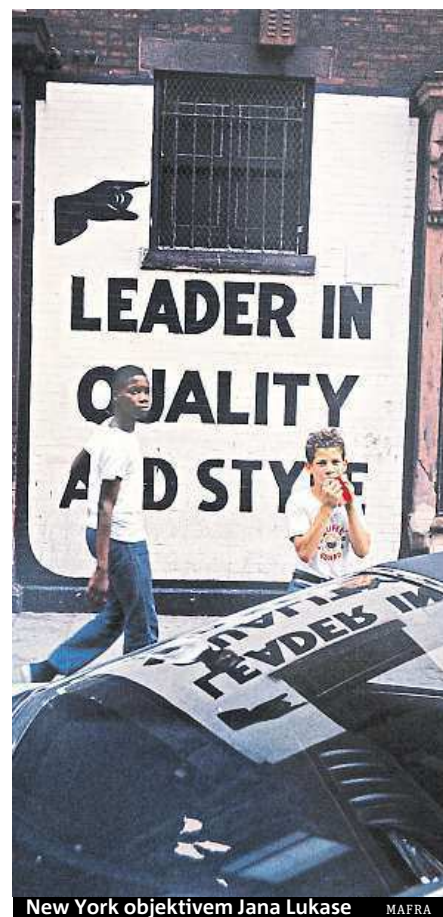
New York objektivem Jana Lukase