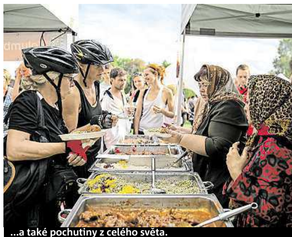
...a také pochutiny z celého světa.

Krátce po slavnostním zahájení ve 14 hodin se na hlav-