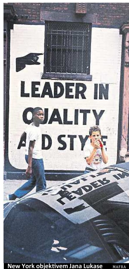
New York