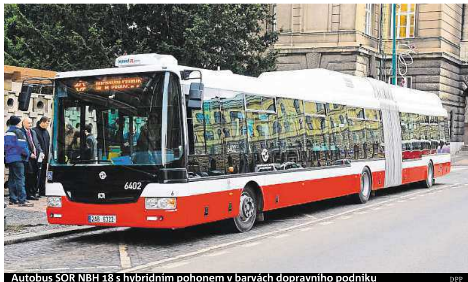
Autobus SOR NBH 18 s hybridním pohonem v barvách dopravního podniku