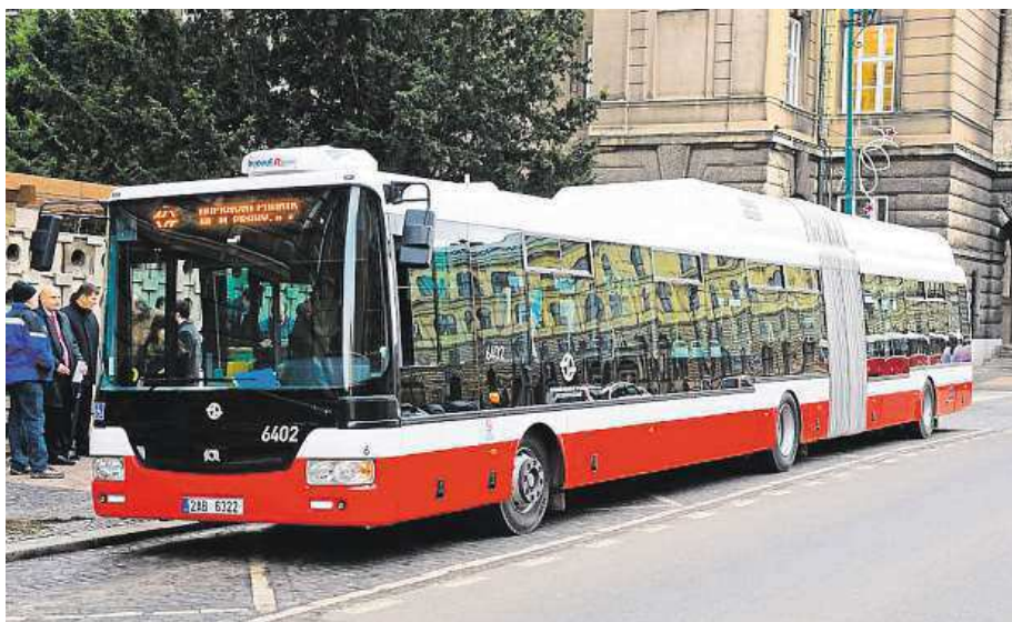
Autobus SOR NBH 18 s hybridním pohonem v barvách dopravního podniku