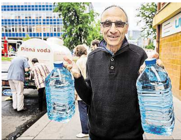
Během kalamity si chodili Dejvičtí pro pitnou vodu.

Souhra nešťastných náhod podle šéfa Pražských vododů a kanalizací (PVK) Petra Mrkose zavinila kalamitu, při které se na konci května tisíce obyvatel Dejvic a Bubence nakazily kontaminovanou vodou z kohoutku. „Kanalizační roury byly položeny nad ty vodovodní. Prasklina na vodovodním řádu vznikla asi až nedávno v souvislosti s výstavbou v okolí. Když se vodovodní potrubí vypustilo, začala do něj natékat prasklinou kontaminovaná spodní voda,“ vysvětlil deníku Metro šéf PVK. Kvůli porušení předpisů se desetitisíce