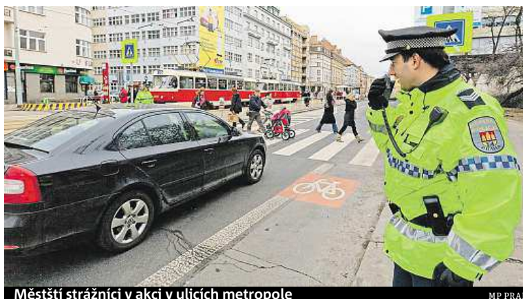
Městští strážníci v akci v ulicích metropole

Strážníci nově zaznamenali i sedmáct případů vjezdu na železniční přejezd, když svítila červená. Podle Šustera nelze přesně říci, na kterých přejezdech se to děje nejčastěji. „Je to různé,“ dodal. ČTK