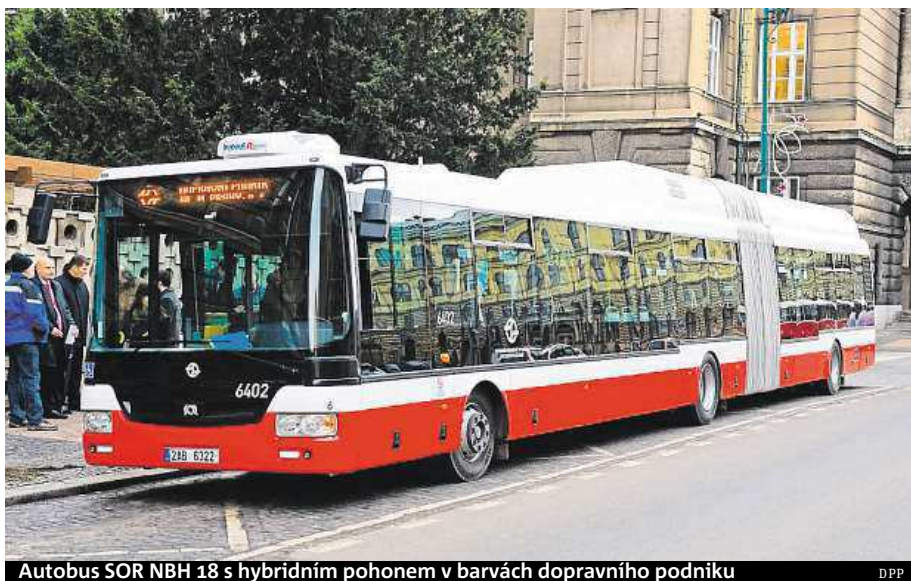
Autobus SOR NBH 18 s hybridním pohonem v barvách dopravního podniku