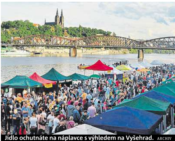
Jídlo ochutnáte na náplavce s výhledem na Vyšehrad.

Mlsné jazýčky se mohou těšit na pestrou paletu chutí z celého světa. Ochutnáte jídlo z indických i španělských ulic. Svůj prostor na festivalu dostanou i marocká a mexická kuchyně. Chybět nebudou ani americké burgery, ho-