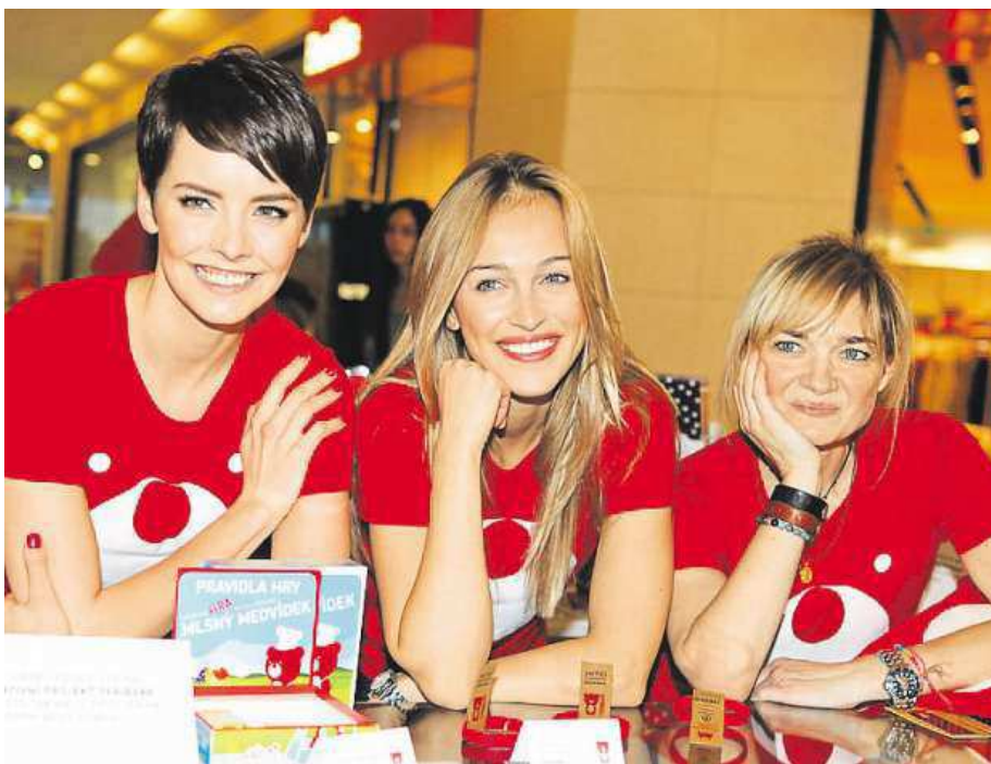
Teribear podporuje návrat dětí z dětských domovů do rodinného prostředí.

„Nezáleží přitom na věku, fyzické kondici nebo čemko- liv jiném – důležitá je ochota pomoci. Přijďte a trasu od- choďte, proběhnete či protan- čete, záleží to pouze na vás,“ uvedla.