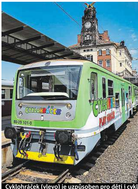
Cyklohráček (vlevo) je uzpůsoben pro děti i cyklisty. V cyklotramvaji proběhne výstava. ROPID

Na své si během dne přijdou i děti a zájemci o pražskou dopravu. „Chystáme jízdy dětským vlakem Cyklohráčkem a ukázkou nového elektrobuse, který testuje do-