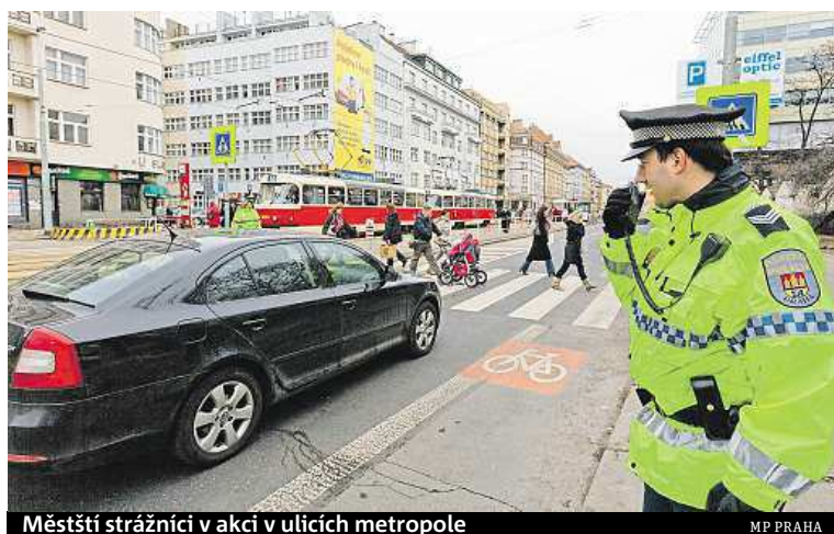
Městští strážníci v akci v ulicích metropole