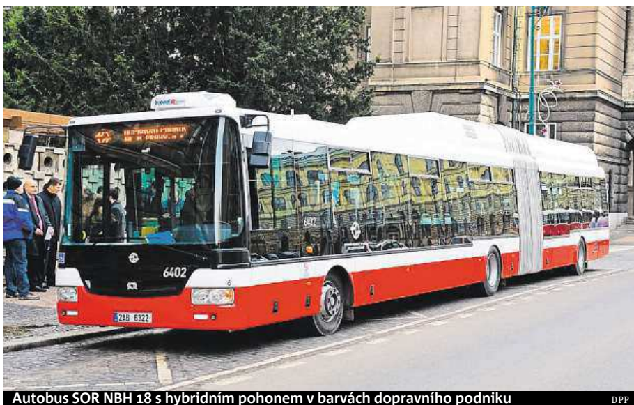
Autobus SOR NBH 18 s hybridním pohonem v barvách dopravního podniku DPP