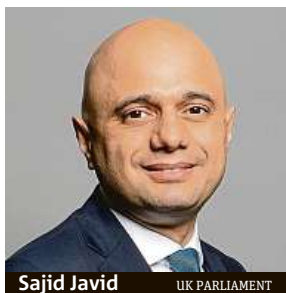
Sajid Javid

„Nešťastný vzkaz“ přišel necelý týden po finálním uvolnění karanténních opatření v Anglii.