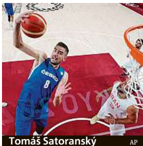
Tomáš Satoranský