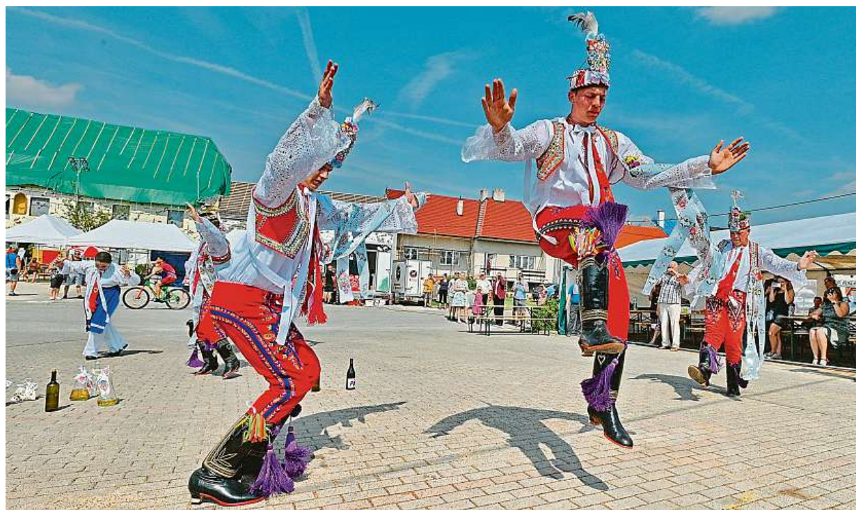
Slovácký krúžek uspořádal v Moravské Nové Vsi na Břeclavsku i přes dopady tornáda tradiční Svatojakubské hody. ČTK

Majitelé. Ve vlastním bytě, nebo domě bydlí 80 procent Čechů. Porovnání. Oproti roku 2000 jsou úvěry na bydlení stále levné, stouply nabídkové ceny. Konec? Odborníci oslabení poptávky zatím nečekají STRANA 2