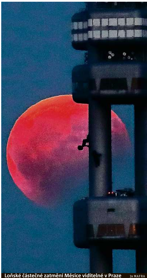
Loňské částečné zatmění Měsíce viditelné v Praze

Úplné zatmění Měsíce bude zítra pozorovatelné ve večerních a nočních hodinách. Podle týdenního výhledu českých meteorologů by mohlo být jasno až polojasno. Hned po soumraku se objeví již polotmavý úplňk nízkou nad jihovýchodním obzorem, což bude v Praze ve 20.47. V jiných částech republiky se bude čas lišit o minuty. V té době už bude levým dolním okrajem ponořen asi 35 procenty svého průměru v zemském stínu. Úplné zatmění začíná ve 21.30 nad jihovýchodním obzorem. Na obzoru bude v té době vycházet jasný Mars. Úplné zatmění skončí ve 23.13, další hodinu pak Měsíc bude vystupovat ze zemského stínu. ČTK