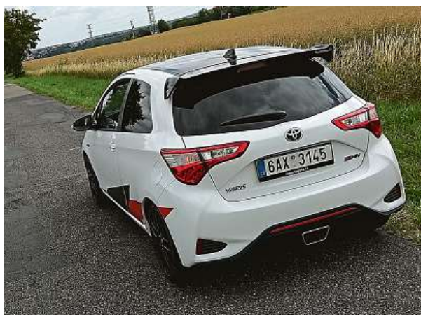
Sportovního ducha podtrhuje zadní spojler a výfuk. 2x METRO