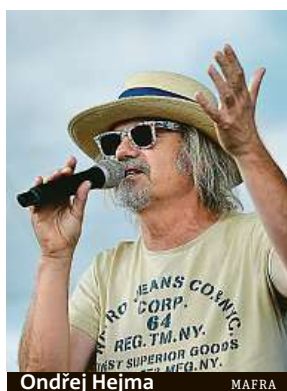
Ondřej Hejma MAFRA

„Cílem festivalu je představit tradice, kulturu, řemesla, gastronomii a další oblasti života v České a Slovenské republice. Podávat se budou nejen oblíbená jídla známých osobností, třeba T. G.