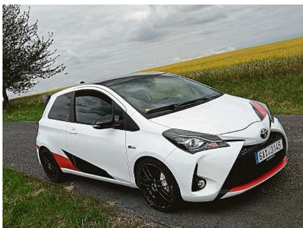
Kombinace klasiky a speciálu pro WRC. To je Yaris GRMN.