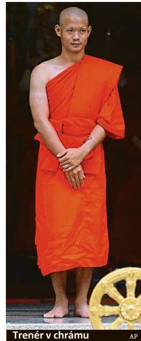
Trenér v chrámu

Jeden ze zachráněných chlapců je křesťan a této ceremonie se neúčastní.