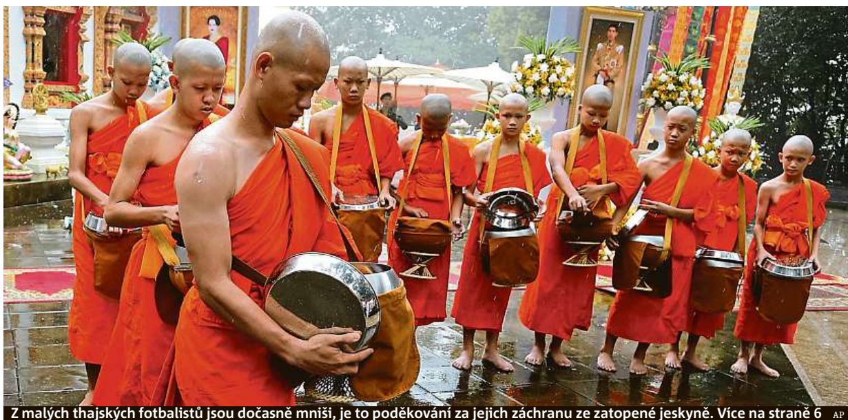
Z malých thajských fotbalistů jsou dočasně mniši, je to poděkování za jejich záchranu ze zatopené jeskyně. Více na straně 6

Syndrom vyhoření. Schopnost využít volného času chybí šéfům i jejich podřízeným. Pětina Čechů. Letos si nedopřeje žádný odpočinek od práce. Dovolená. Většina lidí si bere pouze týden, ale potřeba je více STRANA 3