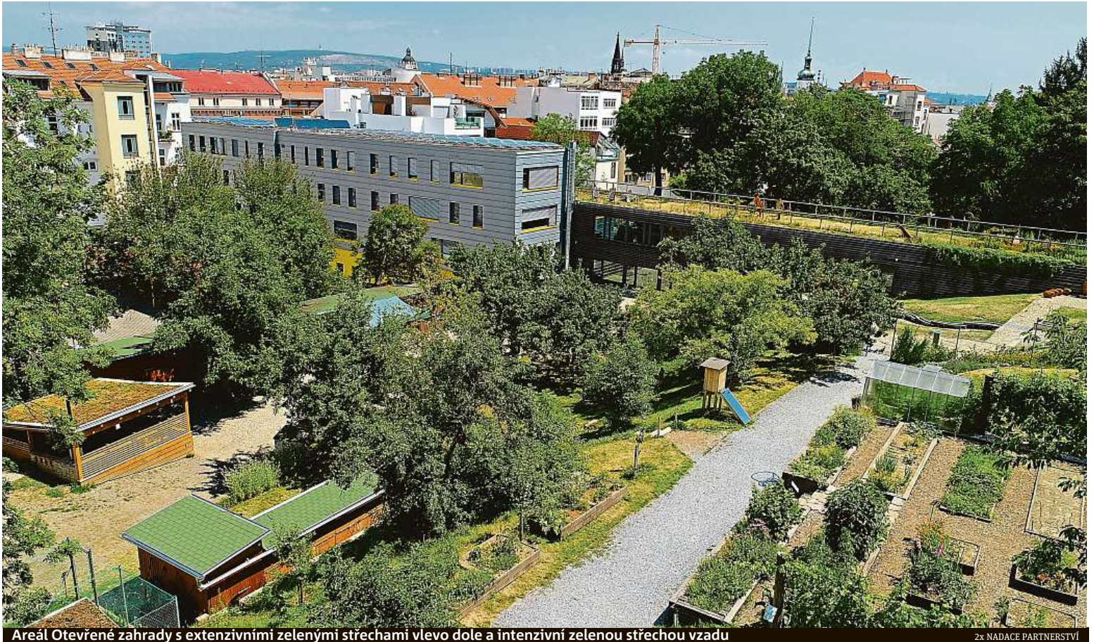
Areál Otevřené zahrady s extenzivními zelenými střechami vlevo dole a intenzivní zelenou střechou vzadu