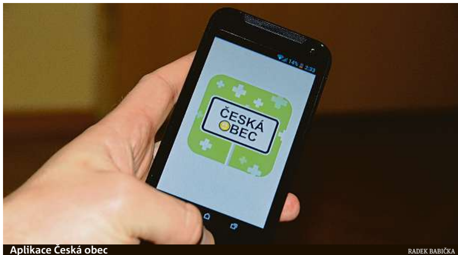
Aplikace Česká obec

„Aplikaci Česká obec máme již několikátým rokem, ale až v současné době rozjíždíme její plné využití pro občany Žabovřesk.