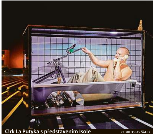
Cirk La Putyka s představením Isole