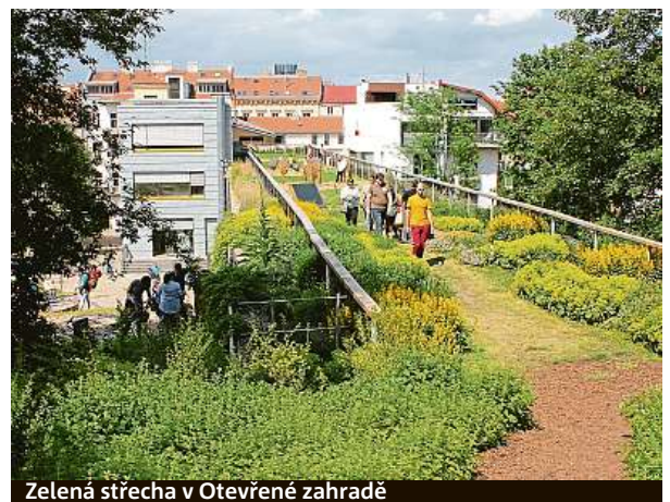
Zelená střecha v Otevřené zahradě

Podpora zelených střech není zdaleka jediným způsobem, jakým se Brno snaží regulovat horko a sucho. Kromě dalších dotačních programů, jako Nachejtek dešťovku nebo Vnitroblok, se magistrát zaměřuje na výsadbu keřových pásů, ozelenění sloupů dopravních vedení či zelené stěny a travnaté zelené pásy tramvajových kolejí. Brno od začátku patřilo