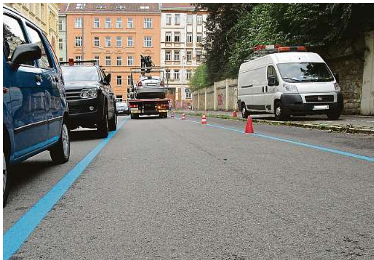
Významné změny začnou již za tři měsíce.