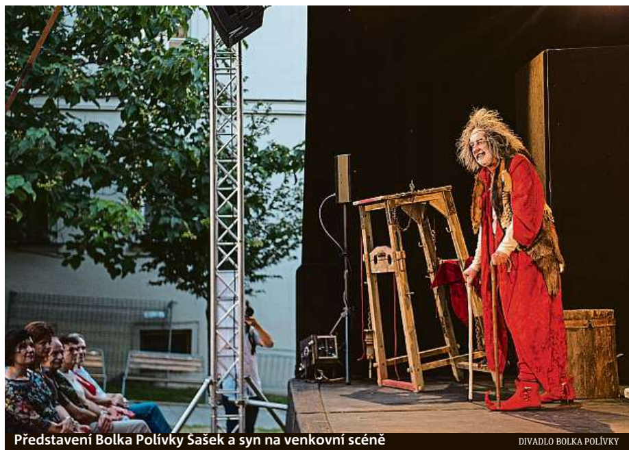
Představení Bolka Polívky Sašek a syn na venkovní scéně