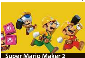
Super Mario Maker 2

Super Mario Maker 2 přináší nový Story Mód s více než stovkou originálních úrovní