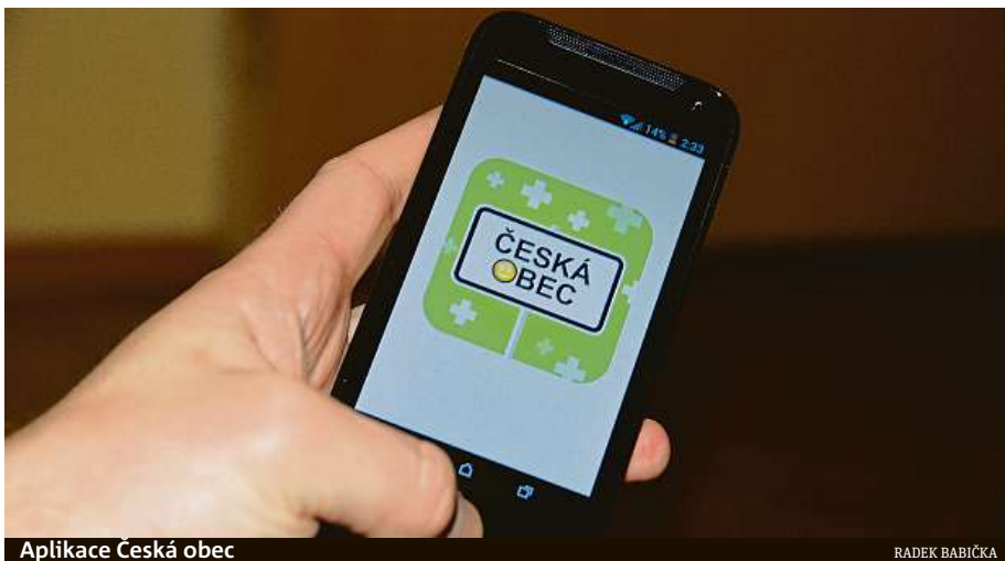
Aplikace Česká obec

„Aplikaci Česká obec máme již několikátým rokem, ale až v současné době rozjíždíme její plné využití pro občany Žabovřesk.