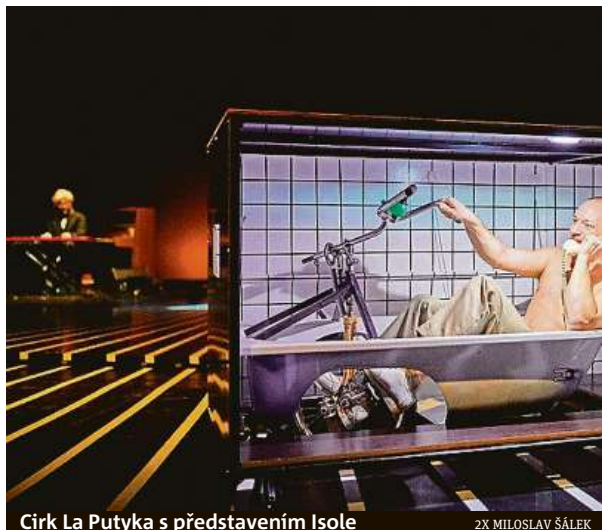
Cirk La Putyka s představením Isole