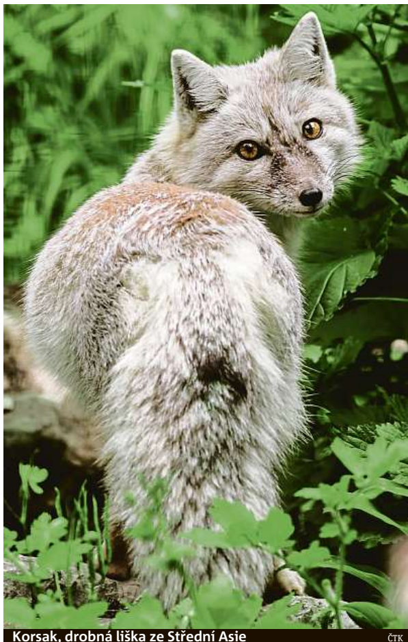
Korsak, drobná liška ze Střední Asie

Zahrada pořídila dvě samice, do zoo přijely z německého Heidelbergu. Starší se narodila 28. dubna 2014 v Hluboké nad Vltavou, mladší 2. dubna 2015 v Saarbrücken. „Pokud se bude korsakům na jihu Moravy dařit, připojí se k liščím dámám i samec,“ doplnil mluvčí. ČTK