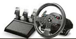
Ještě lepší hraní 2xMIRONET

likost, po stranách je pro lepší úchop pogumovaný. Systém se silovou odezvou umožňuje otáčení volantu v rozmezí až 900 stupňů. Díky unikátnímu systému silové odezvy volant dokáže simulovat třeba pocit při prokluzu kol, přejetí nerovnosti nebo nárazu do překážky. Pod volantem se nachází pádla pro řazení.