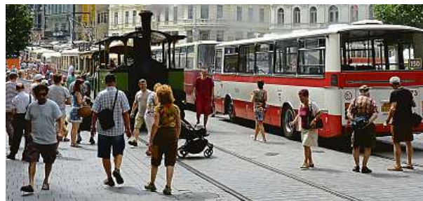
15. června se v Brně slavilo 150 let od vyjetí koňské tramvaje.

Podíl vozů s klimatizací roste s velikostí daného dopravního podniku a města. Nejvíce vozidel s plnou klimatizací má pražský dopravní podnik. Je to celkem 383 autobusů a tramvají, což je přibližně pětina vozového parku podniku. Následují dopravci v Brně se 147 vozy a v Ostravě se 103 vozidly. V některých dalších větších městech jde naopak pouze o jednotky vozidel. Mnozí dopravci instalují techniku přednostně do uzavřené kabiny řidiče, cestující tak pro ochlazení ve vedrech musí spoléhat na otevřená okna. Například Plzeňské městské dopravní podniky mají celkem 321 vozů, z nichž více než 91 procent má klimatizaci v kabině řidi-