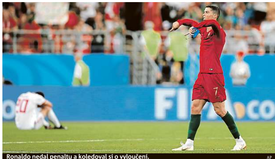
Ronaldo nedal penaltu a koledoval si o vyloučení.

Za Egypt nastoupil nejstarší hráč historie šampionátů. Je mu 45 let.