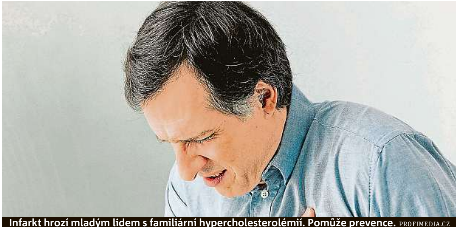
Infarkt hrozí mladým lidem s familiární hypercholesterolémií. Pomůže prevence.