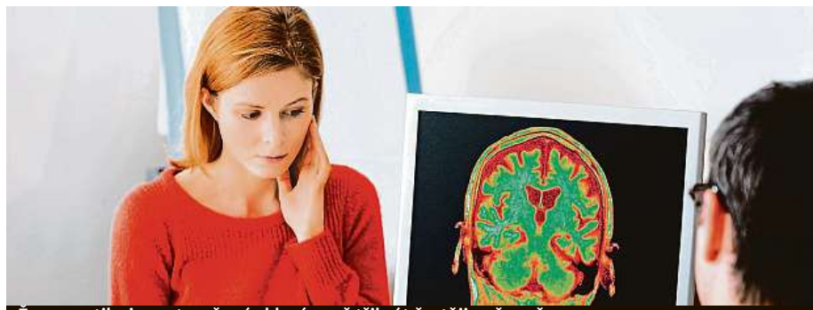
Ženy postihuje roztroušená skleróza až třikrát častěji než muži.

Roztroušená skleróza, epilepsie, parkinson nebo Alzheimerova choroba – to jsou nemoci, které se v populaci vyskytují poměrně často, ale mnoho o nich nevíme. I když se situace lepší.