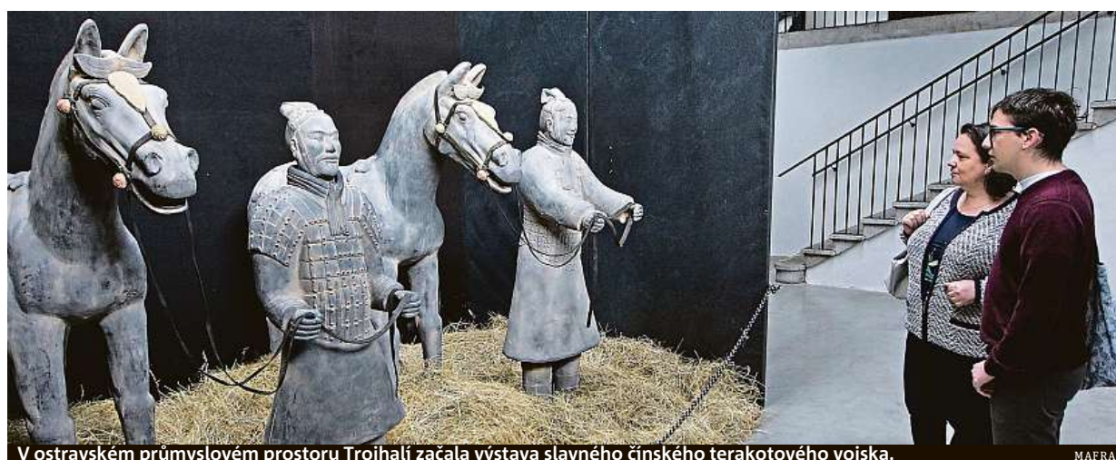
V ostravském průmyslovém prostoru Trojhalí začala výstava slavného čínského terakotového vojska.

Z domova. Od 8. července budou lidé moci začít používat Portál občana. Nová občanka. Díky ní se Češi dostanou ke čtyřem desítkám výpisů a jiných potvrzení. Čtečka. Každý si ji bude muset pořídit STRANA 6