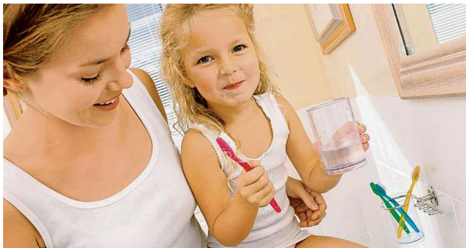
Učte děti starat se o sebe už od dětství.

Výsledky průzkumu ukázaly a zkušenosti ze stomatologické praxe potvrzují, že návyky rodičů týkající se péče o zuby včetně návštěv zubního lékaře souvisí s návyky dětí. To znamená, že děti od svých rodičů přejímají to, jak často si rodiče čistí zuby a jestli chodí pravidelně k zubaři. Nejčastěji si děti i rodiče čistí zuby dvakrát denně, ráno a večer. Rodiče v tomto ohledu ovlivňují své děti, kte-