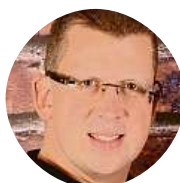
Vladimir Vladimirovič Putin.