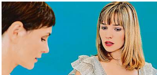
Vaginální problémy trápí řadu dívek a žen.

Poševní infekce doprovázené svěděním a pálením patří mezi nejčastější potíže, které nutí ženy k návštěvě ordinací gynekologů.