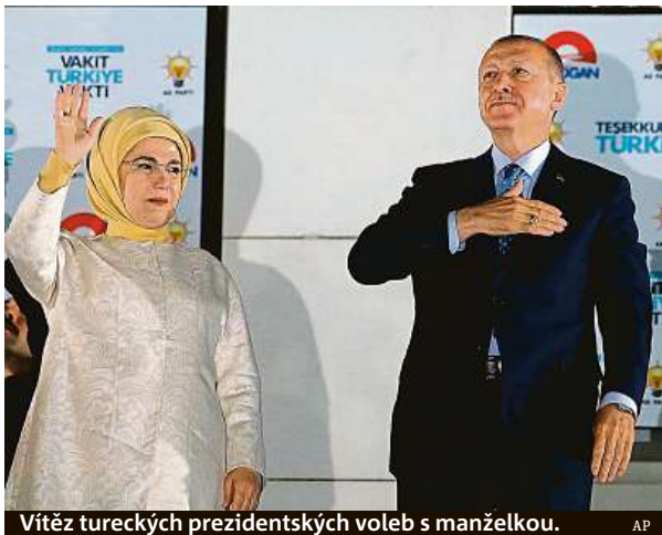
Vítěz tureckých prezidentských voleb s manželkou.

V Německu hlasovali v tureckých volbách pro současnou hlavu státu téměř dvě třetiny tamních Turků.