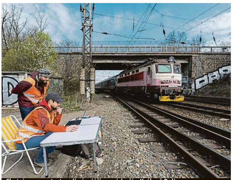
Chytré senzory testovali vývojáři na nádraží v Králové Polí.