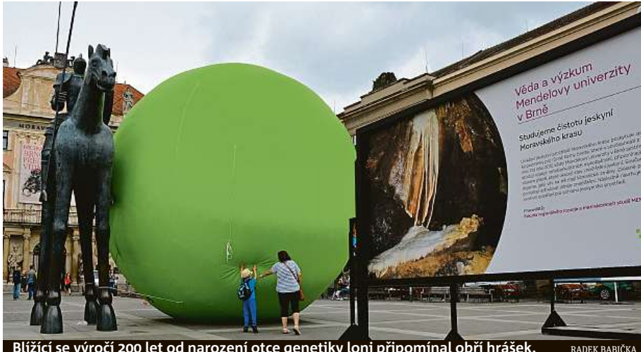
Bližící se výročí 200 let od narození otce genetiky loni připomínal obří hrášek. RADEK BABIČKA

Sbírka by měla přinést patnáct milionů korun, dalších deset milionů přislíbilo dodat město Brno. Zároveň probíhá i soutěž na podobu díla. „Je to dosud největší soutěž v České republice, kdy se na zhotovení díla kombinuje sbírka a příspěvek z veřejných peněz. Vzhledem k osobnosti, která položila základy genetiky, jsou na tento