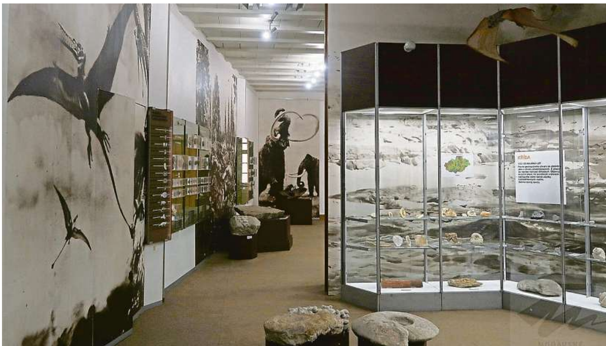
Rekonstruovaná geologická expozice v Moravském zemském muzeu

Tropické korálové útesy, hlubokomořské ryby, hlavoňoži, trilobiti, amoniti a v listí stromů se skrývající dinosaurů... to vše patří k rozmanitosti života na Moravě. Poznat tuto pestrost může veřejnost v Dietrichsteinském paláci, kde se kromě dalších stálých výstav otevřela také nově zrekonstruovaná expozice Zaniklý život na Moravě. Mimořádnou bohatost a význam moravských zkamenělin nově přibližují stovky exemplářů ze současných i historických sběrů. Všechny výstavní sály se během pandemického období dočkaly kompletní přestavby i nových prvků, jako je projekce vzniku Země, chronologická geologická časová osa s klíčovými událostmi ve vývoji života na Zemi či interaktivní dotyková mapa nalezišť zkamenělin na Moravě.