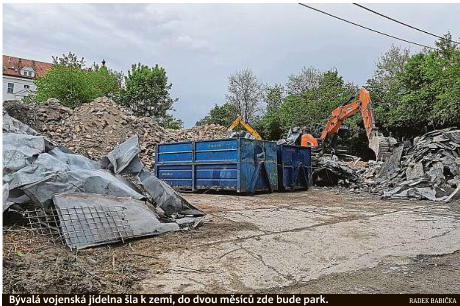
Bývalá vojenská jídelna šla k zemi, do dvou měsíců zde bude park.

Objekt někdejší armádní kuchyně, který stál mezi Stavební fakultou VUT a Gymnáziem Matyáše Lercha, už třicet let chátral, před deseti lety dokonce vyhořel a od té doby tam mezi odpady občas přebývali i bezdomovci. Práce na přeměně lokality v park začaly likvidací náleto-