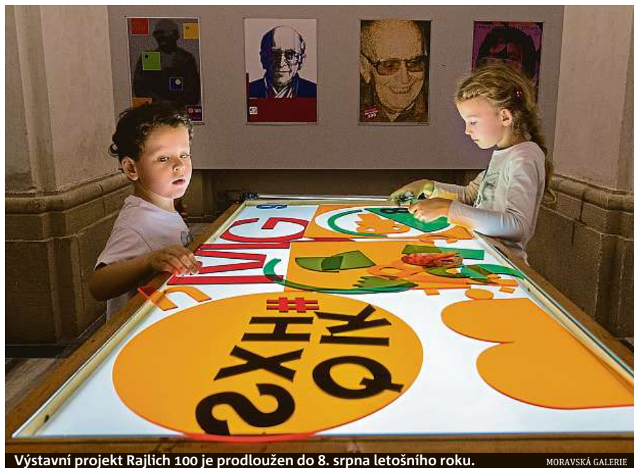
Výstavní projekt Rajlich 100 je prodloužen do 8. srpna letošního roku.

formy na čokoládu, malované plechovky nebo skleněné zásobníky na bonbonky,“ říká správce letohrádku Petr Lukas. Děti se mohou zabavit ve výtvarné dílně tvorbou návrhu dortu nebo výrobou dezertů z papíru. V suterénu pokračuje v upravené podobě výstava o pohádkových postavách.