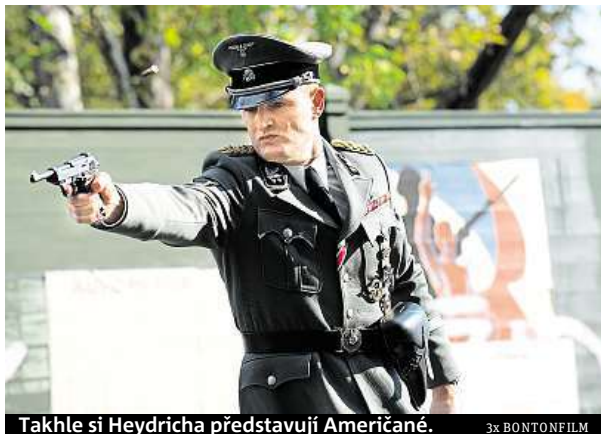
Takhle si Heydricha představují Američané.

Osmého června vstoupí do českých kin film Smrtihlav, výpravne zahraniční zpracování atentátu na Reinharda Heydricha, českého odboje a také příběhu samotného „Pražského kata“. Nejzvučnější hollywoodská jména ve filmu hrají právě Heydricha (Jason Clarke) a jeho ženu