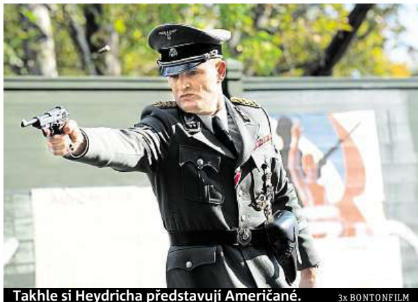
Takhle si Heydricha představují Američané.