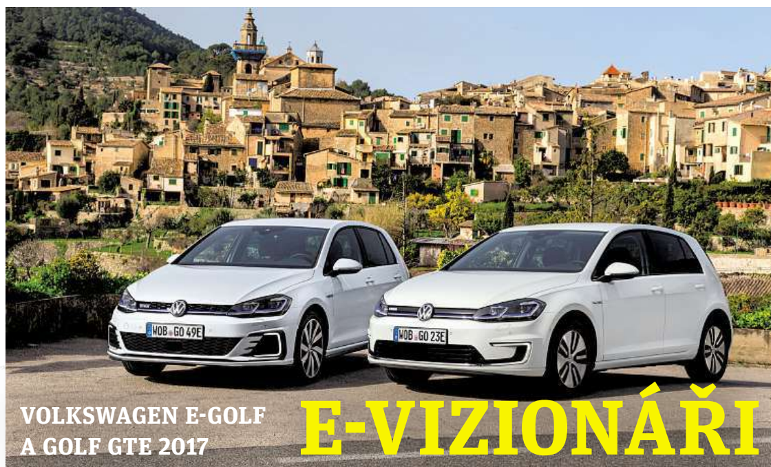
VOLKSWAGEN E-GOLF A GOLF GTE 2017