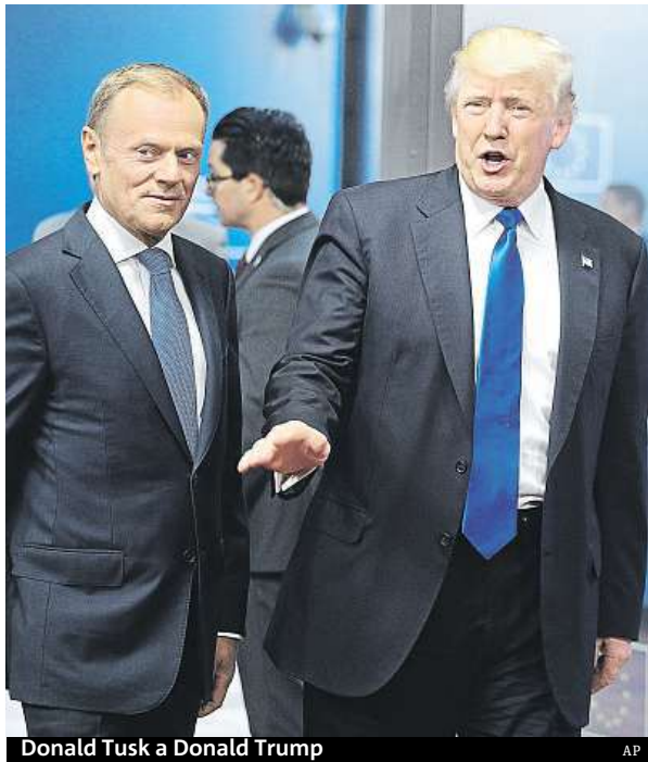
Donald Tusk a Donald Trump

„Všichni spojenci musí splnit to, co se dohodlo v roce 2014,“ upozornil Stoltenberg. Tehdy se na summitu ve Walesu země NATO shodly na zastavení propadu obranných výdajů a postupném nárůstu vydávaných peněz až ke dvěma procentům hrubého domácího produktu v roce 2024. Kromě USA se na požadovanou dvě procenta HDP zatím dostaly jen čtyři země – Řecko, Británie, Polsko a Estonsko. ČTK, MET