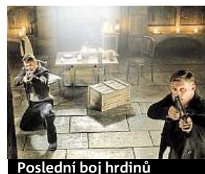
Poslední boj hrdinů

Snímek se natáčel na 35mm film, který více odpovídá době. MET