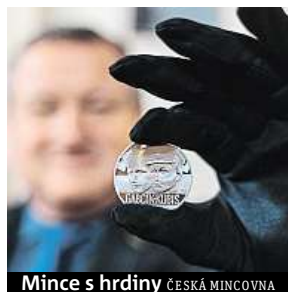
Mince s hrdiny ČESKÁ MINCOVNA