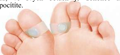
Průměr 3 cm / šířka 1,3 cm. Každý ze 2 prstenů obsahuje 1 neodymový magnet

1 Nasadíte si kroužky, magnety směrem dolů, ve svých botách je dokonce ani nepocítíte.