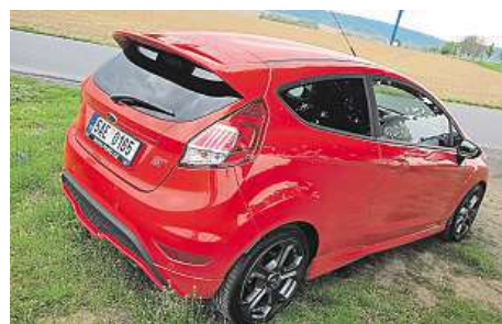
Auta jsme vyzkoušeli na stejném dlouhém okruhu v zatáčkách kolem Dolních Břežan. 6x METRO