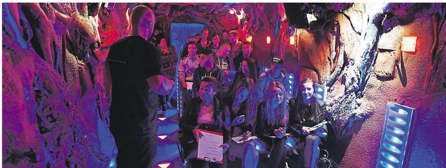
Na hlavní nádraží v Chomutově dorazil protidrogový vlak. Varuje před riziky všech drog. Právě v Ústeckém kraji je druhý nejvyšší počet drogově závislých.

Protikuřácký zákon. Sněmovna ho neschválila, chybělo osm hlasů. Premiér Sobotka: Zákon neprošel kvůli hnutí ANO. Poslanec Šťastný: Lidské zdraví pro velkou řadu politiků této země nic neznamená STRANA 2