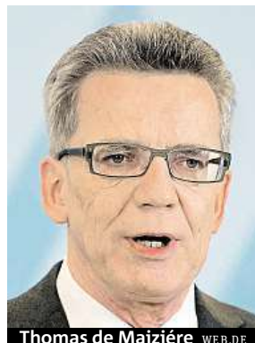
Thomas de Maizière

Zákon pomůže uprchlíkům sehnat práci. Hlídá ale německé hodnoty.