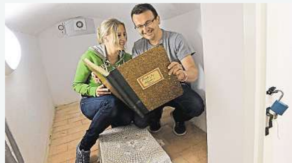
Slavná pevnost Boyard po česku

V novém informačním středisku vybudovaném z bývalé fary v Malenicích na Strakonicku si mohou nejen rodiny s dětmi zahrát interaktivní hru Tajemná farářova komnata,