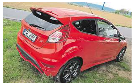
Auta jsme vyzkoušeli na stejném dlouhém okruhu v zatáčkách kolem Dolních Břežan. 6x METRO