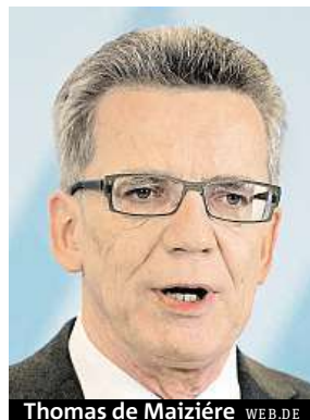
Thomas de Maizière

Zákon pomůže uprchlíkům sehnat práci. Hlídá ale německé hodnoty.