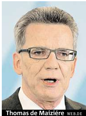
Thomas de Maizière

Zákon pomůže uprchlíkům sehnat práci. Hlídá ale německé hodnoty.