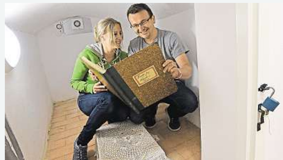
Slavná pevnost Boyard po česku

V novém informačním středisku vybudovaném z bývalé fary v Malenicích na Strakonicku si mohou nejen rodiny s dětmi zahrát interaktivní hru Tajemná farářova komnata,