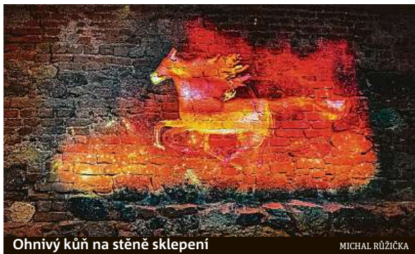
Ohnivý kůň na stěně sklepení

Trvalá výstava seznamuje s minulostí samotného sklepa, dále se zaměřuje na obdo-