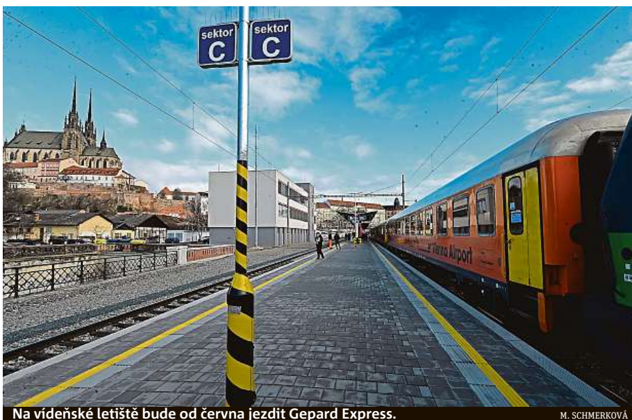
Na vídeňské letišti bude od června jezdit Gepard Express.

Vlak z letiště Schwechat do Brna má stanovaný čas odjezdu na 23:10 a příjezd v 0:45, do Vídně pak bude odjíždět ve 2:15 a na letišti by měl zastavit ve 3:50. V současnosti vlak z Brna vyjíždí ve 3:48 a po zastávkách v Břeclavi a na vídeňském hlavním ná-