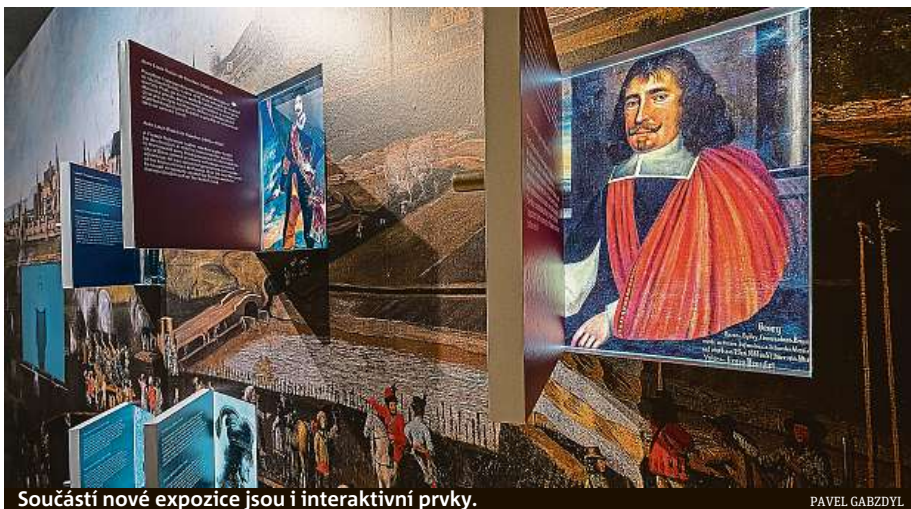
Součástí nové expozice jsou i interaktivní prvky.

Nové pojetí podzemního prostoru láká na moderní audiovizuální technologie, animace Veroniky Vlkové, video-mapping či rozhybaná panorama Brna se světelnými a zvukovými efekty, díky nimž se