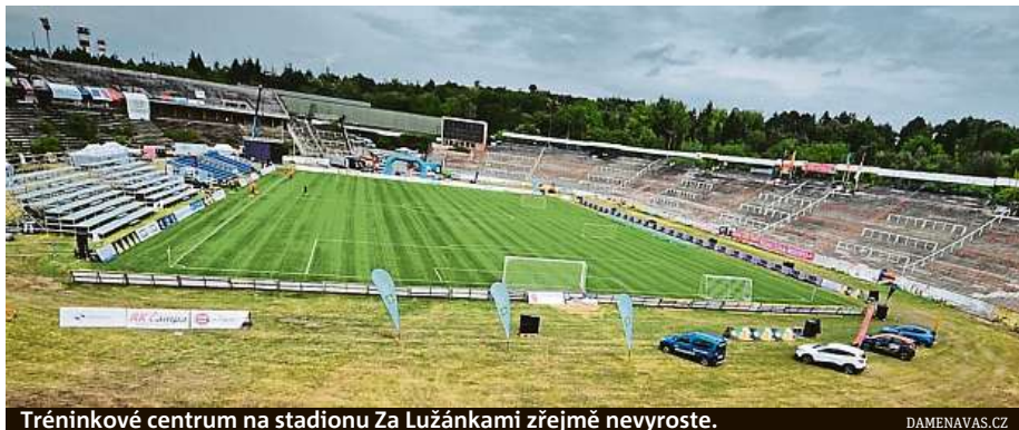
Tréninkové centrum na stadionu Za Lužánkami zřejmě nevyroste.