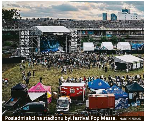
Poslední akcí na stadionu byl festival Pop Messe.