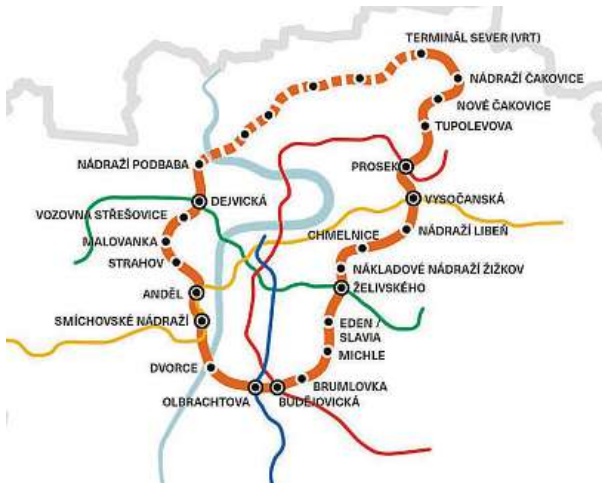
Vizualizace okružního metra

Novou okružní linku O si vyžádá výstavba na pozemcích v bývalých průmyslových areálech mimo cen-