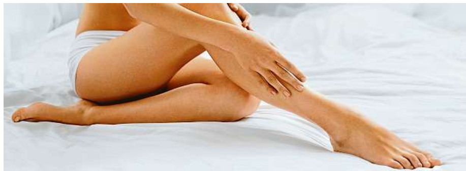
Přitažlivé nohy? Rozhodně bez plísni.