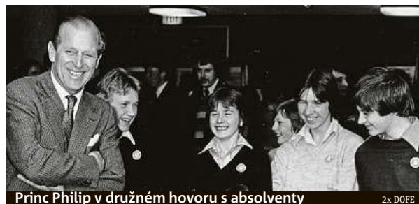
Princ Philip v družném hovoru s absolventy

Vévoda měl nelehké dětství, prošel spoustou škol, neustále putoval po Evropě. Základním se pro něj stalo setkání s pedagogem Kurtem Hahnem, který kladl důraz na učení zážitkem a osobní zkušeností. V roce 1956, kdy