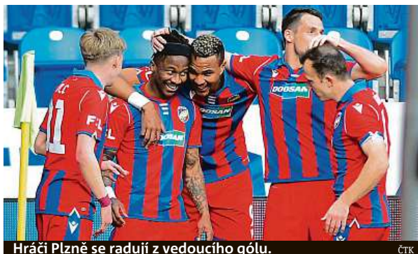
Hráči Plzně se radují z vedoucího gólu.

Ostrava vyhrála soubor součástí v tabulce v Olomouci a poskočila na sedmé místo. Baník poslal v 27. minutě do vedení David Buchta a pojistku přidal v nastavení Filip Kaloch. V 90. minutě za stavu 0:1