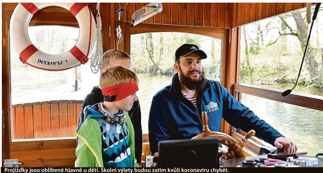
Projíždky jsou oblíbené hlavně u dětí. Školní výlety budou zatím kvůli koronaviru chybět.

Loňská sezona skončila v říjnu, o měsíc a půl dříve než obvykle, přesto si ji Martinek chválí. „Poznamenala ji pandemie, ale našťastí se ukázalo, že Lednice je z většiny závislá na domácím cestov-