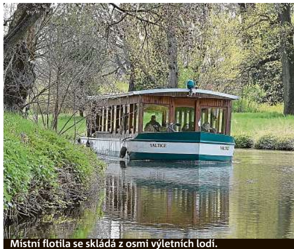
Místní flotila se skládá z osmi výletních lodí.

ním ruchu, pokles turistů ze zahraničí se tedy tolik neprojevil. Lidé navíc taky nemohli moc vyjždět do světa, takže počet cestujících přibyl,“ dodal ředitel. V počátcích přepravovaly výletní lodě na Dyji ročně zhruba 30 tisíc lidí. Jejich počet se postupně zvyšoval až k více než 90 tisícům. Flotila 1. plavební čítá osm osobních lodí a pracovní loď Bobr s jeřábem, která se stará o udržování splavnosti Zámecké a Staré Dyje. Trasa od zámku k minaretu vede po umělém kanálu a trvá 25 minut. Trasa mezi minaretem a Janohradem je o 15 minut delší a vede lužním lesem po Staré Dyji. ČTK