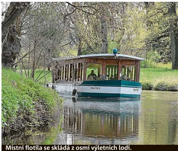
Místní flotila se skládá z osmi výletních lodí.

ním ruchu, pokles turistů ze zahraničí se tedy tolik neprojevil. Lidé navíc taky nemohli moc vyjždět do světa, takže počet cestujících přibyl,“ dodal ředitel. V počátcích přepravovaly výletní lodě na Dyji ročně zhruba 30 tisíc lidí. Jejich počet se postupně zvyšoval až k více než 90 tisícům. Flotila 1. plavební čítá osm osobních lodí a pracovní loď Bobr s jeřábem, která se stará o udržování splavnosti Zámecké a Staré Dyje. Trasa od zámku k minaretu vede po umělém kanálu a trvá 25 minut. Trasa mezi minaretem a Janohradem je o 15 minut delší a vede lužním lesem po Staré Dyji. ČTK