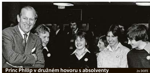
Princ Philip v družném hovoru s absolventy

Vévoda měl nelehké dětství, prošel spoustou škol, neustále putoval po Evropě. Základním se pro něj stalo setkání s pedagogem Kurtem Hahnem, který kladl důraz na učení zážitkem a osobní zkušeností. V roce 1956, kdy