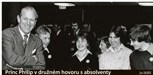
Princ Philip v družném hovoru s absolventy

Vévoda měl nelehké dětství, prošel spoustou škol, neustále putoval po Evropě. Základním se pro něj stalo setkání s pedagogem Kurtem Hahnem, který kladl důraz na učení zážitkem a osobní zkušeností. V roce 1956, kdy