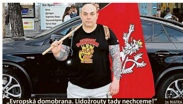
„Evropská domobrana. Lidožrouty tady nechceme!“