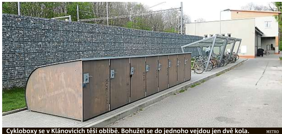
Cykloboxy se v Klánovicích těší oblibě. Bohužel se do jednoho vejdu jen dvě kola. METRO

„V květnu bychom měli mít dalších osm boxů, které jsou již několik měsíců zamluveny. Občané za ně platí 2400 korun na dva roky pronájmu, tedy stovku na měsíc. Samozřejmě mě ale na celé věci zarazí cena osmnáct tisíc korun, kterou musíme za boxy ročně odvádět Technické správě komunikací, i fakt, že měly být hotové už koncem loňského roku,“ říká pro deník Metro starostka Starčevičová.