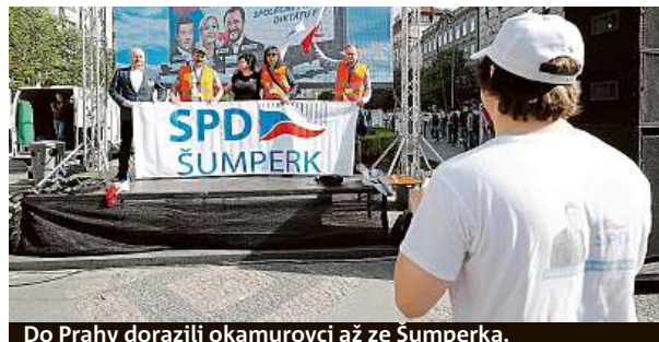
Do Prahy dorazili okamurovci až ze Šumperka.

Na tribunu v horní části Václavského náměstí dorazili lídr SPD a také jeho zahraniční hosté. Mezi nimi byla předsedkyně francouzského Národního sdružení Marine Le Penová nebo předseda nizozemské Strany pro Svobodu Geert Wilders. ČTK