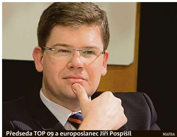
Předseda TOP 09 a europoslanec Jiří Pospíšil

Nejhůře snáším odloučení od svých dvou psů – fenek amerických teriérů. Uvažoval jsem o tom, že bych je do Evropského parlamentu propa-