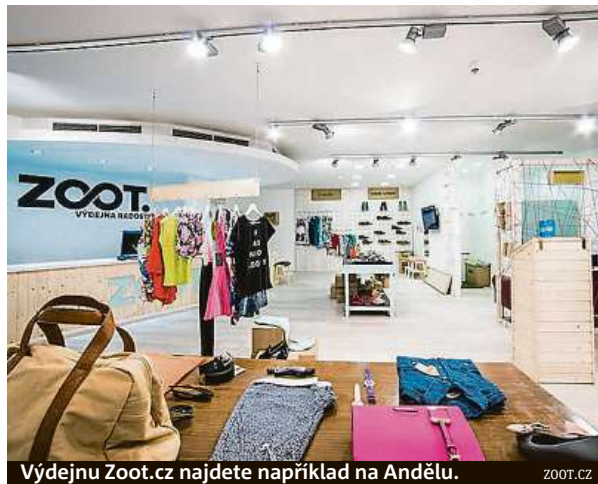
Výdejnu Zoot.cz najdete například na Andělu.

Že je největší český e-shop prodávající a má díky tomu vážné finanční problémy, se