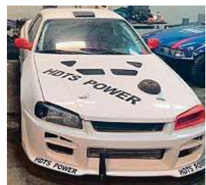
Nissan Skyline za 1,5 milionu korun je bílé barvy s černými nápisy HOTS Power. POLICIE ČR

návrátvé prýc a někomu poslouží na náhradní díly. Bylo totiž velmi atypické a známé ze závodů v driftování po Evropě. ČTK a iDNES.cz