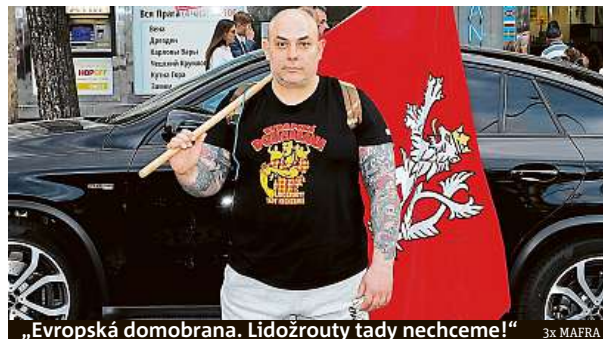
„Evropská domobrana. Lidožrouty tady nechceme!“