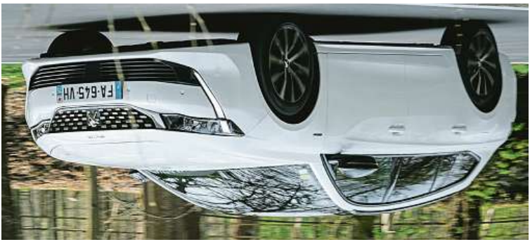
Dle úspěšnosti uvedení fastbacku se Peugeot 508 ukazuje i v oblibě varianty kombi. Ta je v Česku hned po SUV a 70 kg lehčí. Navzdory sportovnímu vzezření nabídné kombi komfortní svezení. Vícepřevodová zadní náprava a francouzsky vymazlený podvozek skvěle maskují nedokonalost povrchu.

Po úspěšném uvedení fastbacku se Peugeot 508 ukazuje i v oblibě varianty kombi. Ta je v Česku hned po SUV a 70 kg lehčí. Navzdory sportovnímu vzezření nabídné kombi komfortní svezení. Vícepřevodová zadní náprava a francouzsky vymazlený podvozek skvěle maskují nedokonalost povrchu. Dle úspěšnosti uvedení fastbacku se Peugeot 508 ukazuje i v oblibě varianty kombi. Ta je v Česku hned po SUV a 70 kg lehčí. Navzdory sportovnímu vzezření nabídné kombi komfortní svezení. Vícepřevodová zadní náprava a francouzsky vymazlený podvozek skvěle maskují nedokonalost povrchu. Dle úspěšnosti uvedení fastbacku se Peugeot 508 ukazuje i v oblibě varianty kombi. Ta je v Česku hned po SUV a 70 kg lehčí. Navzdory sportovnímu vzezření nabídné kombi komfortní svezení. Vícepřevodová zadní náprava a francouzsky vymazlený podvozek skvěle maskují nedokonalost povrchu.