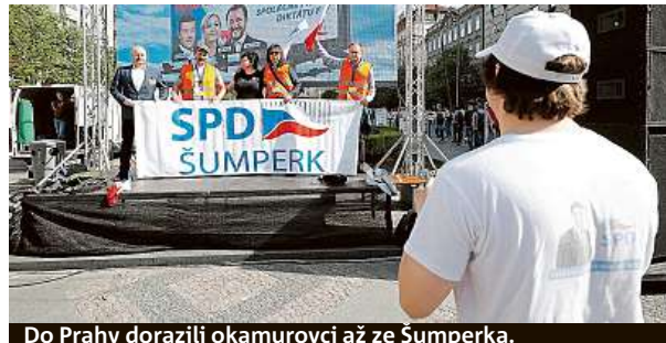
Do Prahy dorazili okamurovci až ze Šumperka.

Na tribunu v horní části Václavského náměstí dorazili lídr SPD a také jeho zahraniční hosté. Mezi nimi byla předsedkyně francouzského Národního sdružení Marine Le Penová nebo předseda nizozemské Strany pro Svobodu Geert Wilders.