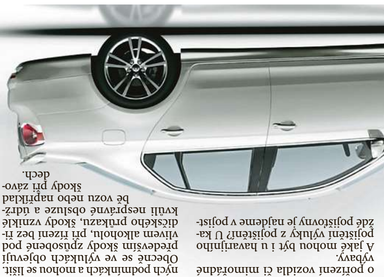
Obecně se ve výlukách objevují především škody způsobené podvlečením alkoholem, při řízení bez řádné péče nebo při zavážení přepravního prostředku. Škody vzniklé kvůli nesprávné obsluze a údržbě vozů nebo například škody při zavážení přepravního prostředku.

Jak mají ale řidiči postupovat v situaci, kdy je auto poničeno, například se odvíjí především od dovozu auta, aby bylo možné pokračovat v jízdě? Postup vyplatit pojištění plnění? Pokud likvidace se odvíjí především od dovozu auta, jaké částí odškodnění se můžete domoci? Pokud budete pokračovat v jízdě, jaké částí odškodnění se můžete domoci? Pokud budete pokračovat v jízdě, jaké částí odškodnění se můžete domoci? Pokud budete pokračovat v jízdě, jaké částí odškodnění se můžete domoci?