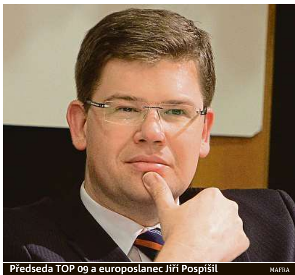
Předseda TOP 09 a europoslanec Jiří Pospíšil

Mám to životní štěstí, že se málokdy nudím. Největší nebezpečí v Bruselu jsou belgic-