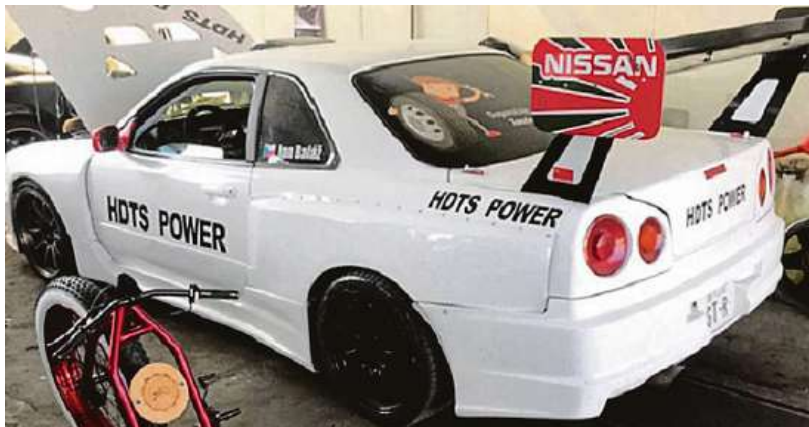
Nissan Skyline za 1,5 milionu korun je bílé barvy s černými nápisy HOTS Power.

Policie vyhlásila celostátní pátrání po ukradeném závodním speciálu Nissan Skyline, který zatím neznámý zloděj zcizil v noci na středu. Vůz za 1,5 milionu korun byl zaparkovaný v areálu jedné firmy v Trutnově. V případě dopadení hrozí pachateli či pachatelům až osm let ve vězení. Majitel auta a závodník v driftování nechtěl ztrátu komentovat, velmi ho mrzí. Tvrdí, že auto už nejspíš bude nenávratně pryč a někomu poslouží na náhradní díly. Bylo totiž velmi atypické a známé ze závodů v driftování po Evropě. ČTK a IDNES.cz