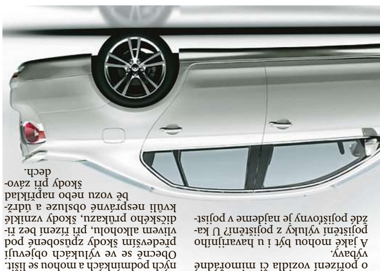
dech. škody při závo- bě vozu nebo například kvůli nesprávné obsluze a údrž- dě tohoto průkazu, škody vzniklé víhem alkoholu, při řízení bez ti- především škody způsobené pod- Obecně se ve výlukách objevují ných podmínek a mohou se lišit o pořízení vozidla či mimoriadně

Jak mají ale řidiči postupovat v situaci, kdy je auto poškozeno, například při nehodě, aby likvidace byla provedena bez problémů a pojišťovna motoristovi vyplatila pojistné plnění? Postup likvidace se odvíjí především od do- nebo o vandaní, které pojišťovně motorista dodá, na jejich základě musí likvidátor stanovit, zda se, s ohledem na zjištěný rozsah poškození vozidla technikem pojišťovny při o z n a m e - prohlídce, jedná o tzv. parciální, nebo totální škodu. Ale co když vám auto nebo jeho část odcizí? o dlo z e n i p r í p a d u, Tady je důležité mít na paměti, že pro vyplatu plnění je v těchto případech bezpodmínečně nutné, aby udalost šetřila Police ČR. Pro likvidaci udalosti je potřeba do- ložit doklady, na jejichž základě li- kvidátor udalost posoudí a stanoví vší pojistného plnění. K těmto do- kladům patří hlášení škodní udá- losti, kopie technického průkazu, faktura za opravu, odtah, protokol Police ČR, pokud udalost šetřila. V případech, kdy se jedná o kra- dež vozidla či jeho část nebo o vandaní, kdy je potřeba do- ložit ještě