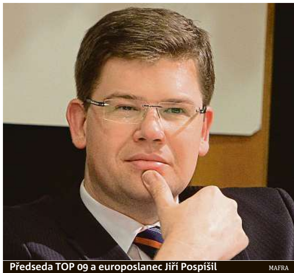
Předseda TOP 09 a europoslanec Jiří Pospíšil

Mám to životní štěstí, že se málokdy nudím. Největší nebezpečí v Bruselu jsou belgic-