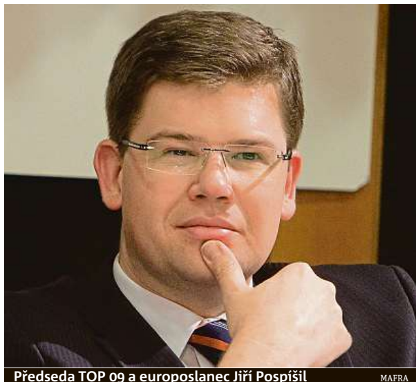
Předseda TOP 09 a europoslanec Jiří Pospíšil

Mám to životní štěstí, že se málokdy nudím. Největší nebezpečí v Bruselu jsou belgic-