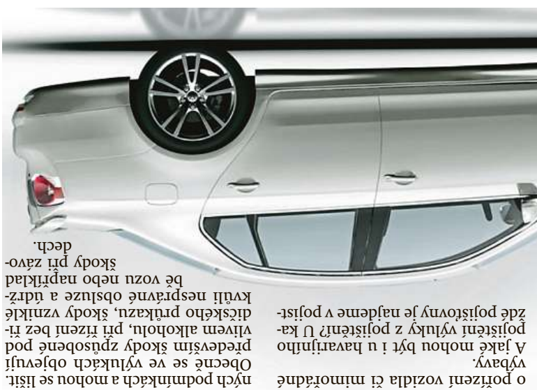
dech. škody při závo- bě vozu nebo například kvůli nesprávné obsluze a údržbě vozidla, škody vzniklé při řízení bez tr- věném alkoholů, při řízení bez tr- Především škody způsobené pod- Obecně se ve výlukách objevují- ných podmínek a mohou se lišit o pořízení vozidla či mimoriadně- výbavy.

Jak mají ale řidiči postupovat v situaci, kdy je auto poněkud narušené nebo odčísané, aby likvidace se odvíjela především od dovozu vozidla či jeho částí? Postup v případě, kdy se jedná o krádež vozidla či jeho částí nebo o vandalismus, je potřeba dovolat ještě předem policii ČR, pokud událost šetříla. V případě, kdy se jedná o krádež vozidla či jeho částí nebo o vandalismus, je potřeba dovolat ještě předem policii ČR, pokud událost šetříla. V případě, kdy se jedná o krádež vozidla či jeho částí nebo o vandalismus, je potřeba dovolat ještě předem policii ČR, pokud událost šetříla.