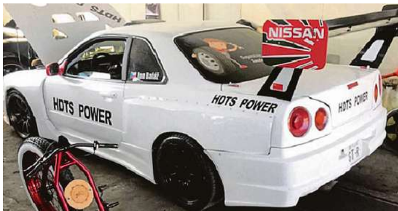
Nissan Skyline za 1,5 milionu korun je bílé barvy s černými nápisy HOTS Power.

Policie vyhlásila celostátní pátrání po ukradeném závodním speciálu Nissan Skyline, který zatím neznámý zloděj zcizil v noci na středu. Vůz za 1,5 milionu korun byl zaparkovaný v areálu jedné firmy v Trutnově. V případě dopadení hrozí pachateli či pachatelům až osm let ve vězení. Majitel auta a závodník v driftování nechtěl ztrátu komentovat, velmi ho mrzí. Tvrdí, že auto už nejspíš bude nenávratně pryč a někomu poslouží na náhradní díly. Bylo totiž velmi atypické a známé ze závodů v driftování po Evropě. ČTK a IDNES.cz