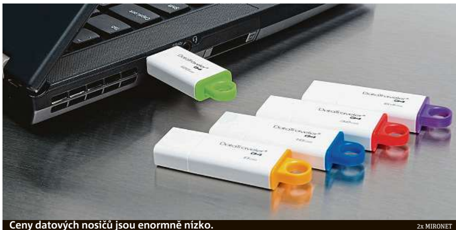
Ceny datových nosičů jsou enormně nízké.