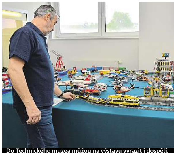
Do Technického muzea můžou na výstavu vyrazit i dospělí.

Poskládané modely obsahují více než půl milionu dílků. Výstava mapuje vývoj série Technic od roku 1990. „Styl se postupem času mění. Sady uvedené po roce 2000 používají odlišnou konstrukční metodiku a více se blíží realitě,“