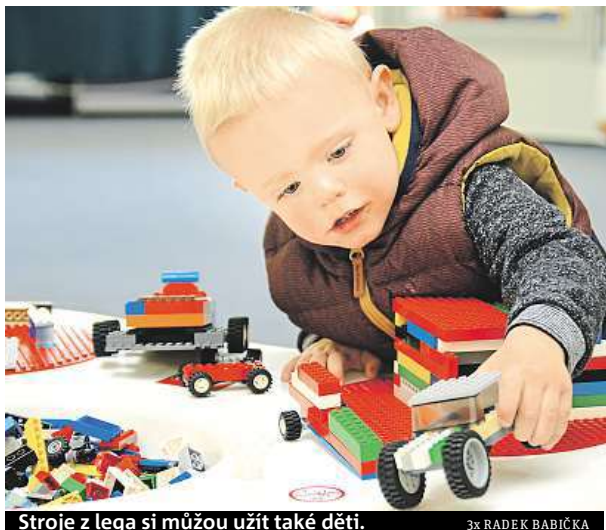
Stroje z lega si můžou užít také děti.

„Výstava se zaměřuje zejména na sérii sady Lego Technic. Tyto stavebnice obsahují kromě jiného technická zařízení, z nichž si mohou lidé postavit například bagr, pyrotechnický vůz a další. Ně-