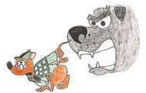
Na knihu se sbírají peníze.

brat 60 tisíc korun, aby mohla knihu vydat ve vyšším nákladu. Za odměnu dárci získají třeba pohlednice, magnetky, omalovánky či placky s hlavními hrdiny. „Cílem je vydání knihy a distribuce do školek, škol a volnočasových center v Brně,“ dodává Svobodová. RADEK BABIČKA