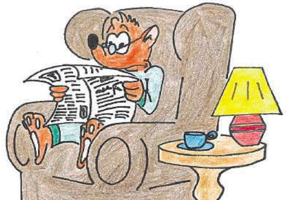
Knihy přivede děti na skutečná místa v Brně.