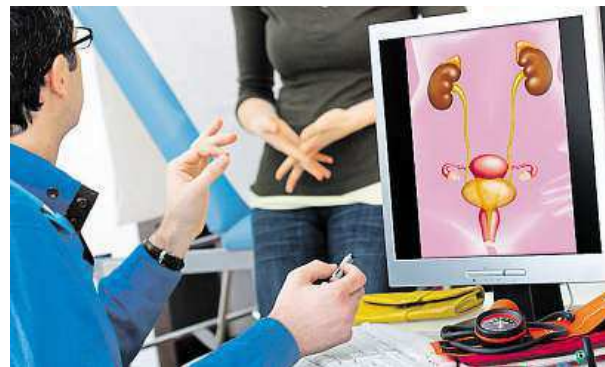
S problémy včas vyhledejte lékaře.

Infekce močových cest ale trápí také muže. Řezání či pálení při močení může být příznakem i závažnějších problémů. MET