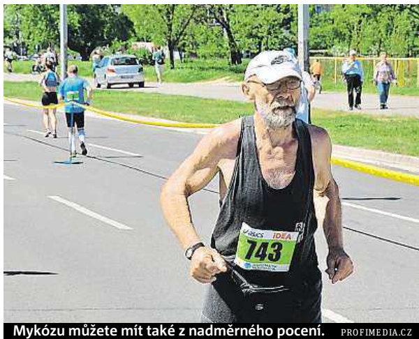
Mykózu můžete mít také z nadměrného pocení.

Na již poškozené nehty se doporučuje použít vhodný přípravek, který proniká přímo do nehtu, kde ho čistí a zpevňuje (například Urgo Poškozené nehty Filmogel).