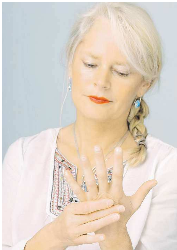
Bolestmi kloubů častěji trpí ženy.