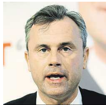
Prezidentský kandidát N. Hofer

Evropská média upozorňují na to, že Rakousko stejně jako ostatní evropské země zaznamenává nárůst krajní pravice. Jasným důvodem je neřešení přistěhovačské krize a zvyšování nezaměstnanosti. COB, ČTK