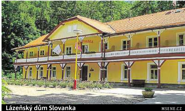
Lázeňský dům Slovanka

Lázeňský resort Mšené si na sobotu 7. května připravil pro své hosty a návštěvníky opravdu zajímavou nabídku.