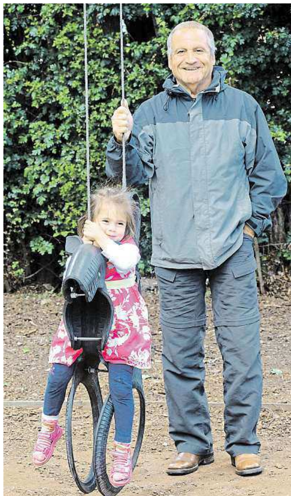
S pohybem vám pomohou třeba i vnoučata.

Mírný stupeň zapomínání může ohlašovat nastupující nemoc mozku. Komu hrozí toto riziko, přitom nelze jednoznačně určit. Vhodné je proto důkladné vyšetření, pravidelné kontroly, dodržování pravidel zdravého životního stylu se zaměřením na paměťové funkce a užívání podpůrných léků. KAMILA HUDEČKOVÁ