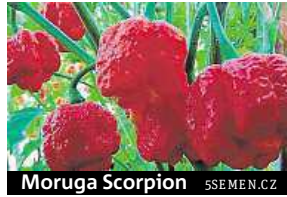
Moruga Scorpion 5SEMEN.CZ

Jak již sám název napovídá, tato nádhera pochází ze souostroví Trinidad a Tobago. Poměrně dlouho byla i bez zápisu do knihy rekordů považována za nejpálivější na světě. U některých plodů bylo naměřeno šilných 2 047 000 SHU!!! Trinidad Moruga Skorpion má mnoho mutací, například Red, Yellow, Brown... Tato rostlina je trvalka a dá se pěstovat prak-