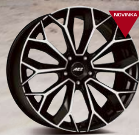
AEZ Leipzig dark 20" - 22"