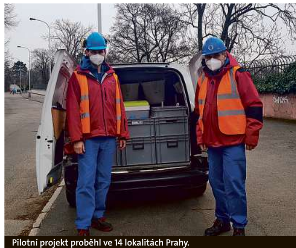
Pilotní projekt proběhl ve 14 lokalitách Prahy.

Více informací naleznete na: www.pvk.cz a www.vscht.cz