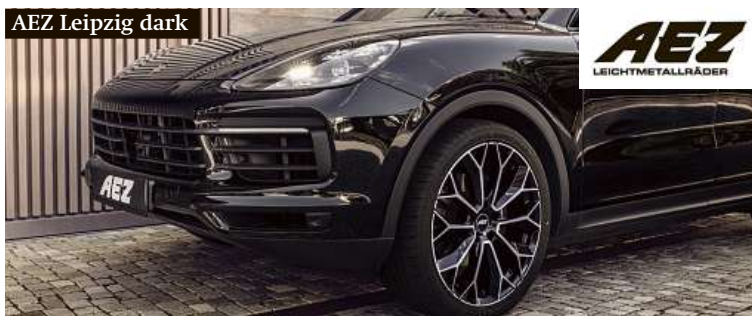
AEZ Leipzig dark

Alcar Bohemia svým zákazníkům opět zvýhodňuje nákup prémiových značek litých kol AEZ a DOTZ. Stačí si společně s koly objednat také bezpečnostní šrouby či matice Sicuplus. Ty dostanete od ALCARu jako dárek zdarma. Akce platí od 1. 3. do 30. 6. 2021 a motoristé ji tak mohou využít během celé jarní sezony přezouvání.