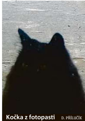
Kočka z fotopasti D. PŘÍLUČÁK

Někteří lidé procházejí a na exponáty se dívají pouze letmo, jiní se naopak zastaví a čekají, co videa nabídnou.