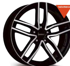
DEZENT TR dark 16" - 18"