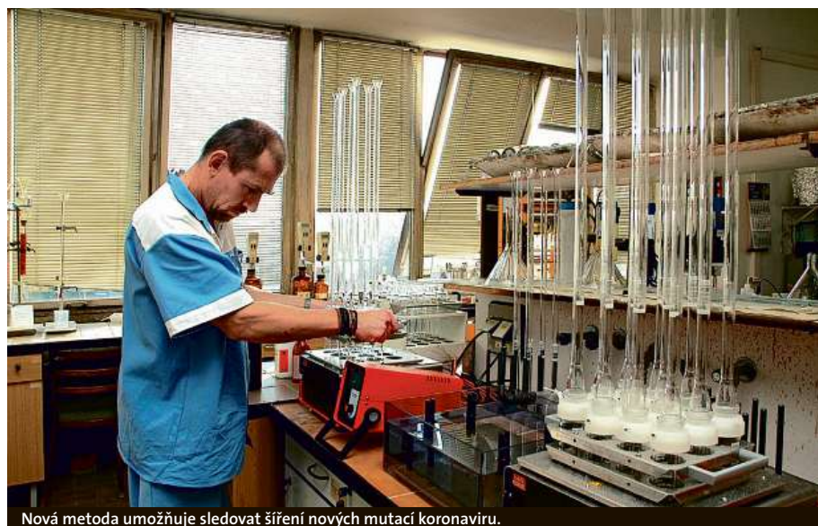
Nová metoda umožňuje sledovat šíření nových mutací koronaviru.

Z klinických dat vyplývá, že minimálně 45 % pacientů s nemocí covid-19 vylučuje ve stolici RNA viru SARS-CoV-2, a to i v případě, že netrpí průjmovými obtížemi, popř. nevykazují vůbec symptomy