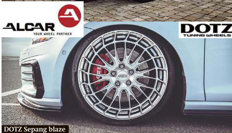
DOTZ Sepang blaze