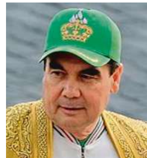
Prezident země

Zatímco po útoku v Atlantě vypukly demonstrace proti rostoucí nenávisti vůči Ameri-