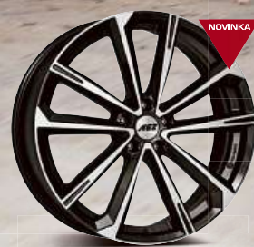
AEZ Aruba dark 18" - 21"