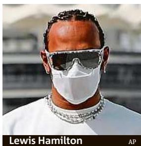
Lewis Hamilton

Velká výzva čeká letos na úřadujícího krále Hamiltona. Šestatřicetiletý jezdec aspiruje nejen podle počtu titulů na post nejlepšího jezdce dějin, zároveň ho dělí jen pět výher od jubilejní sté. Hned v úvodu sezony ale musí napravit nepovedené testy, při nichž se potýkal s problémy v zadní části vozu a dostával se do přetáčivého smyku. Přesto