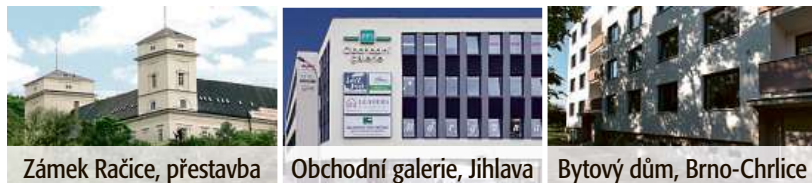
Zámek Račice, přestavba