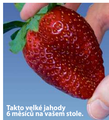
Takto velké jahody 6 měsíců na vašem stole.

Ano, nyní se již nepotřebujete ohýbat, abyste sbírali na zemi a v blátě jahody, které napadli živočišové ještě předtím, než byly zralé.