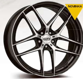
DOTZ LagunaSeca dark 19" - 21"