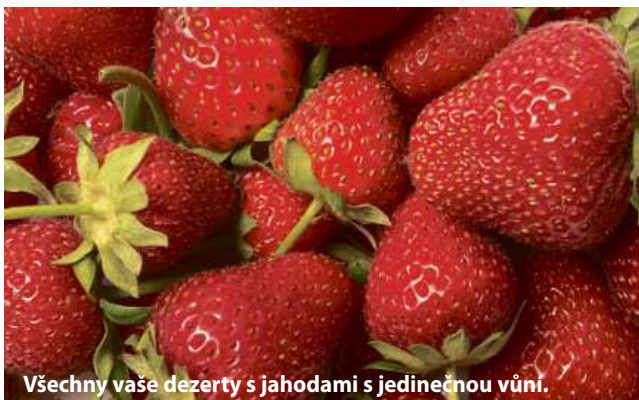
Všechny vaše dezerty s jahodami s jedinečnou vůní.