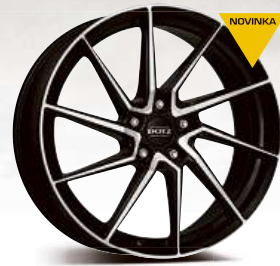
DOTZ Spa dark 17" - 19"