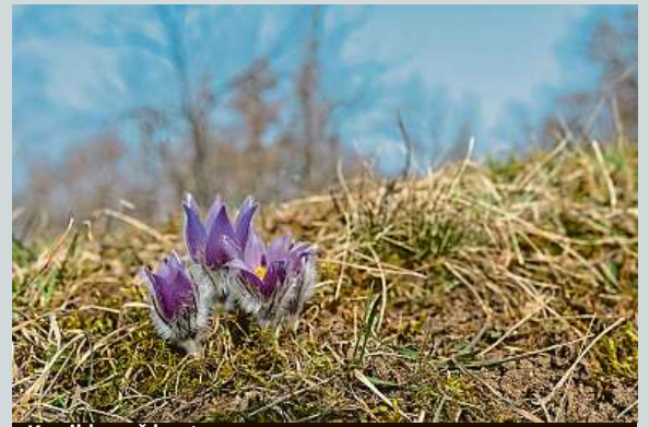
Koniklec už kvete.