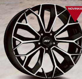
AEZ Leipzig dark 20" - 22"