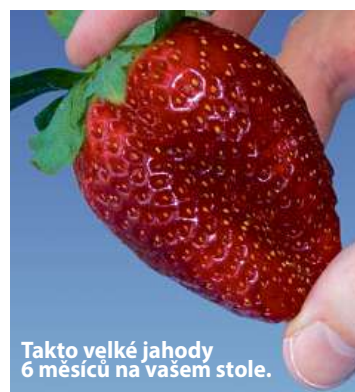
Takto velké jahody 6 měsíců na vašem stole.

Ano, nyní se již nepotřebujete ohýbat, abyste sbírali na zemi a v blátě jahody, které napadli živočišné ještě předtím, než byly zralé.