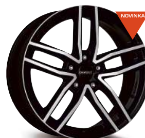
DEZENT TR dark 16" - 18"