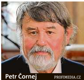
Petr Čornej

Specialista na dějiny pozdního středověku Petr Čornej je autorem ceněných publikací.