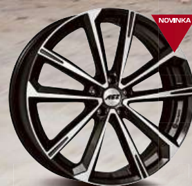
AEZ Aruba dark 18 - 21"