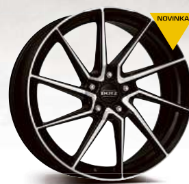
DOTZ Spa dark 17" - 19"