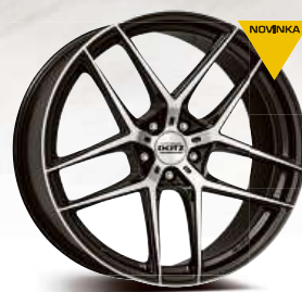
DOTZ LagunaSeca dark 19" - 21"