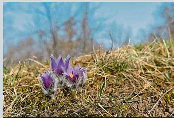
Koniklec už kvete.