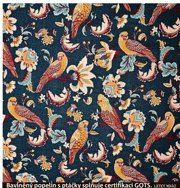
Bavlněný popelín s ptáčky splňuje certifikaci GOTS. LÁTKY MRÁZ

„V tomto případě je to ale o vzájemné důvěře mezi výrobcem a jeho dodavatelem, který pouze deklaruje výhradní použití bio-surovin. Naprostou jistotu a možnost ověření představuje nejprůběžnější mezinárodní certifikát GOTS (Global Organic Textile Standard). Ten zaručuje, že celý proces od pěstování bavlny